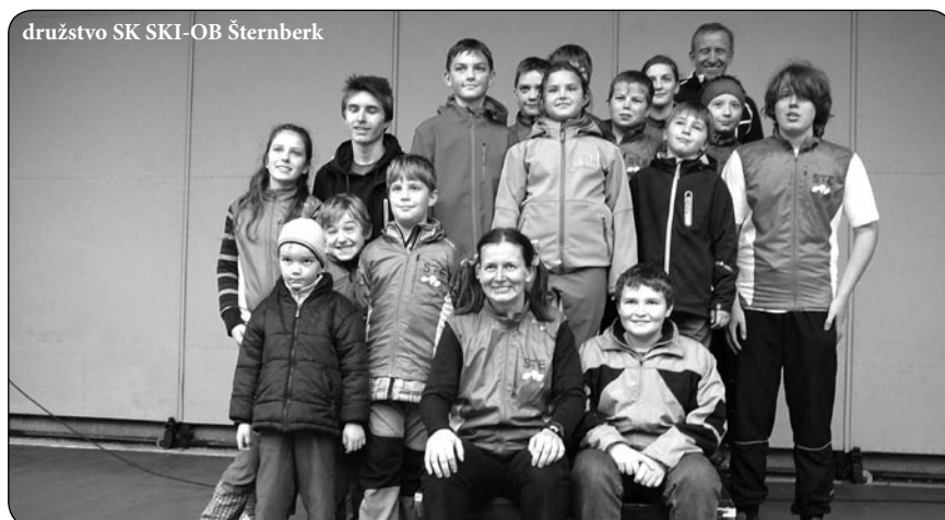
družstvo SK SKI-OB Šternberk