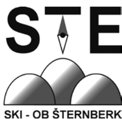
SKI - OB ŠTERNBERK

Sportovní klub SKI-OB Šternberk je dobrovolným zájmovým sdružením založeným roku 1992 a jeho činnost je rozdělena na dvě oblasti. Hlavní směr