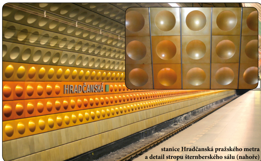
stanice Hradčanská pražského metra a detail stropu šternberského sálu (nahore)