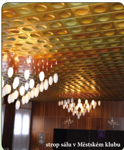
strop sálu v Městském klubu

S obrovským zájmem veřejnosti se setkala akce Kup si kus historie, dej budoucnost knihovně. Městská kulturní zařízení začala minulý měsíc