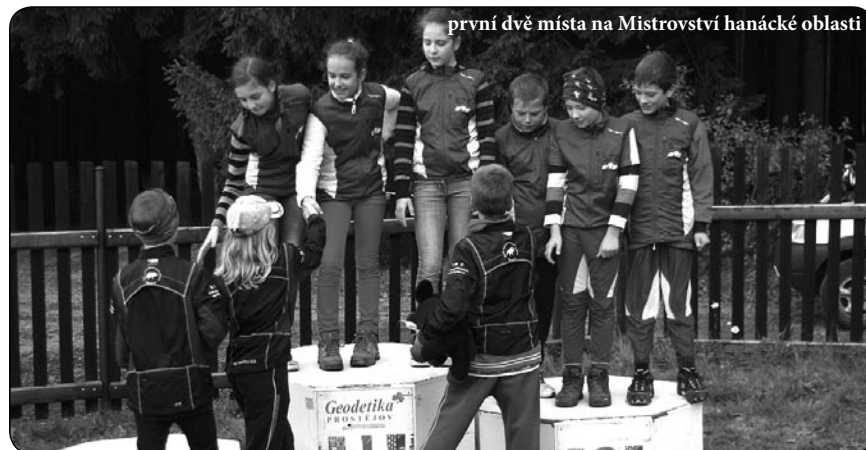
první dvě místa na Mistrovství hanácké oblasti