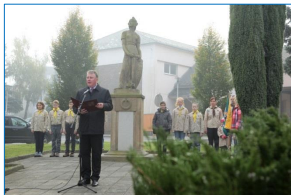
Vzpomínkový akt u příležitosti státního svátku 28. října 2014 na náměstí Svobody