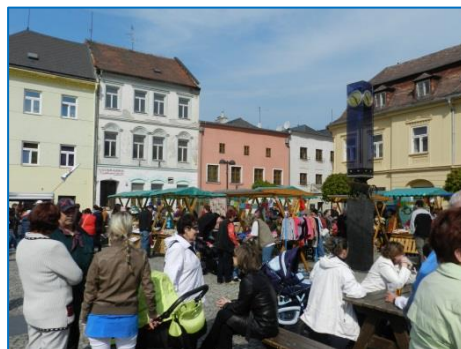
Velikonoční Venkovské trhy Šternberk na Hlavním náměstí