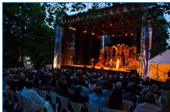
Muzikál Noc na Karštějně v rámci zahájení II. ročníku Šternberského kulturního léta pod hvězdami