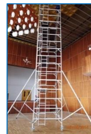
Demontáž obkladů z Městského klubu v dubnu 2014