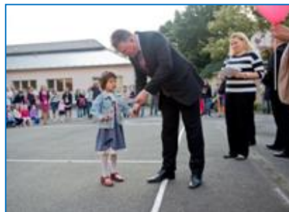
Zahájení školního roku na základních školách Svatoplukova, Dr. Hrubého a náměstí Svobody