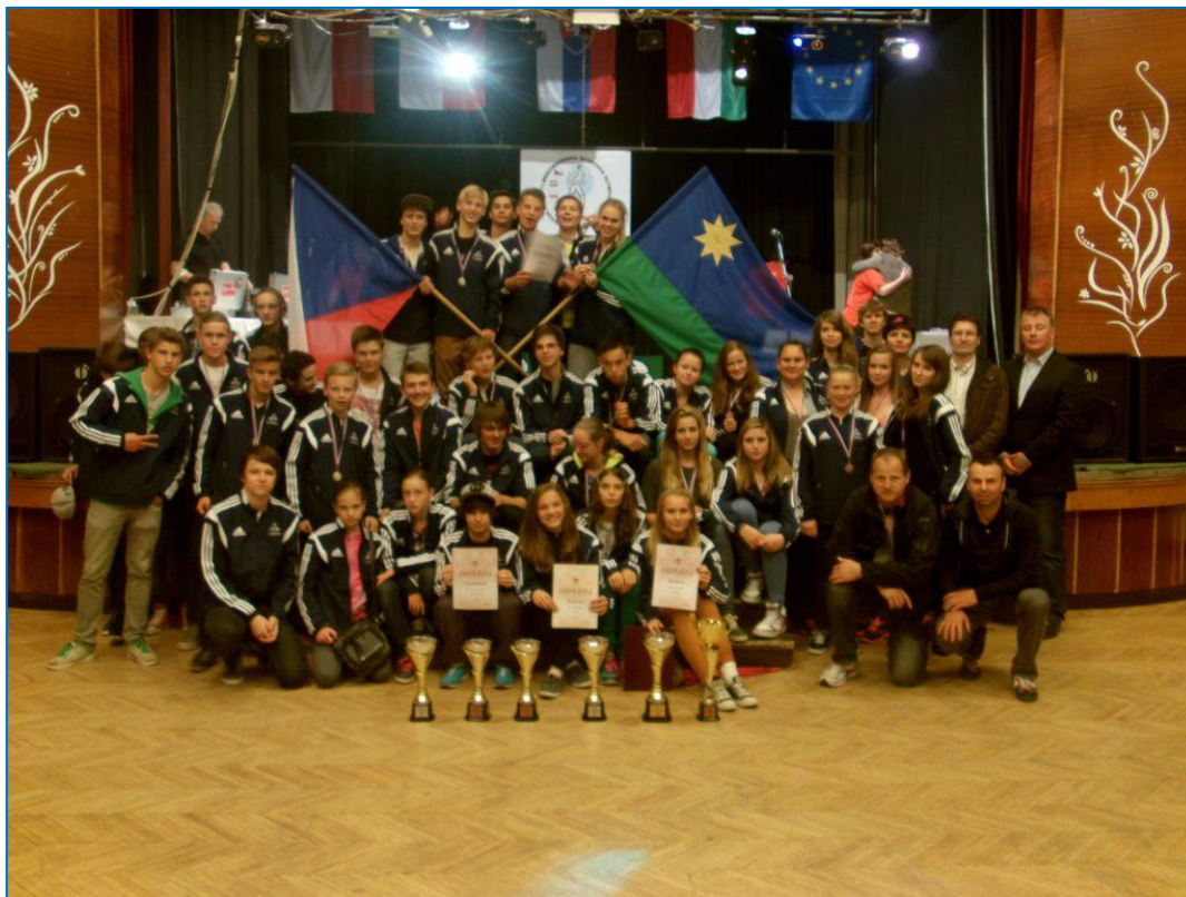
Mladí šternberští sportovci na Sportovní hrách mládeže partnerských měst v Dobšíně na Slovensku