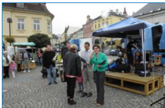
Vyhlášení výsledků soutěže o nejhezčí květinovou výzdobu