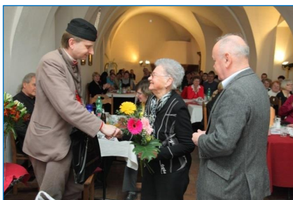
Oslava 90. výročí založení Tělocvičné jednoty Sokol Šternberk