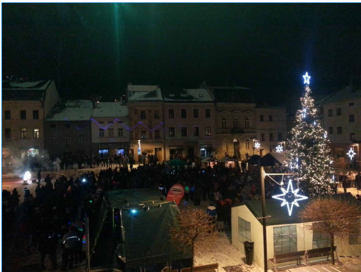
Závěr roku 2014 oslavili obyvatelé města na Hlavním náměstí

Zpracovala: Mgr. Irena Černocká vedoucí oddělení personalistiky a vnějších vztahů tisková mluvčí březen 2015