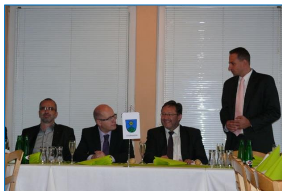
Premiér Bohuslav Sobotka na návštěvě ve Šternberku