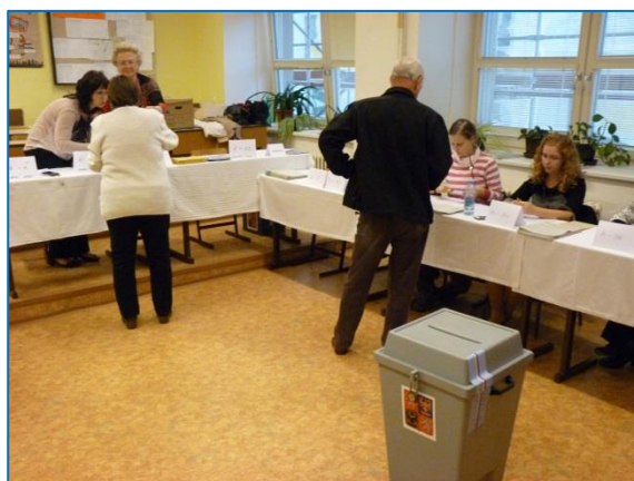
Komunální volby 2014 ve Šternberku