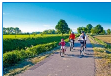
Otevření cyklostezky Hvězdná - úsek Bohuňovice Olomouc