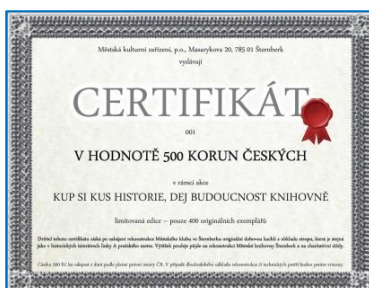
Certifikát na kachle