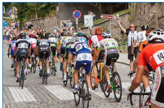
Etapový cyklistický mezinárodní závod Czech Cycling Tour, Královská etapa ve Šternberku