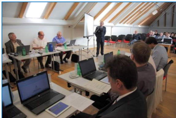
Hasiči převzali na zastupitelstvu osvětlovací balon