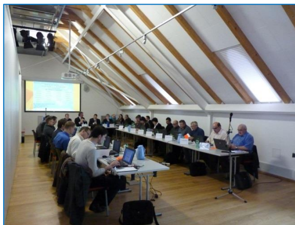
Veřejné zasedání zastupitelů 18. února 2014