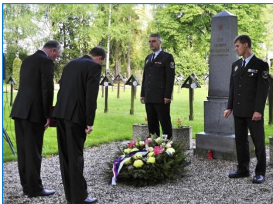
Vzpomínkový akt u příležitosti Dne vítězství na hřbitově

Na hradě proběhnul za velkého zájmu tradiční svatební veletrh. Ve městě byla zřízena poradna pro občany starší 50 let, která nabízí pomoc v nepříznivé životní situaci. Harmonie Šternberk získala od Olomouckého kraje cenu za výjimečný počin v oblasti kultury. Na městském hřbitově proběhnul tradiční vzpomínkový akt ke Dni vítězství. Šternberané se zapojili do projektu Uklidíme Česko!, přišlo však pouze devět statečných dobrovolníků. Mladí šternberští sportovci získali třetí místo na Sportovních hrách mládeže partnerských měst v Dobšíně na Slovensku.