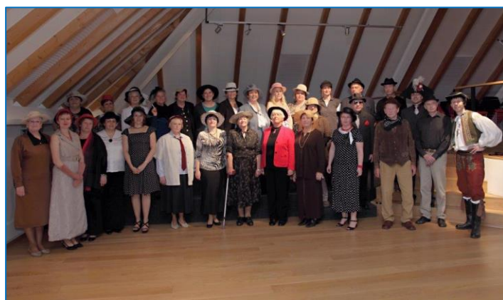
Pěvecký sbor Šternberk oslavil 40. výročí založení