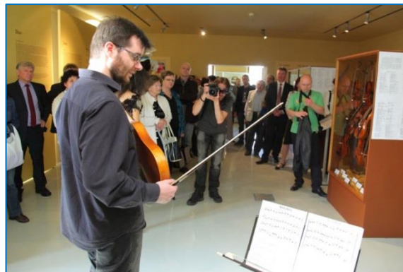
Zahájení výstavy Čas houslí v Expozici času