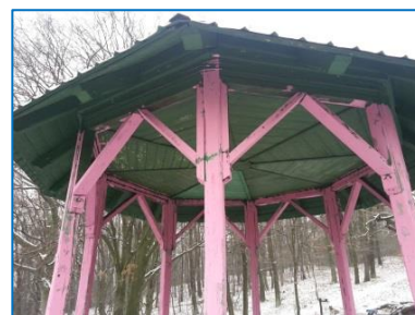
„Růžová“ Zelená budka