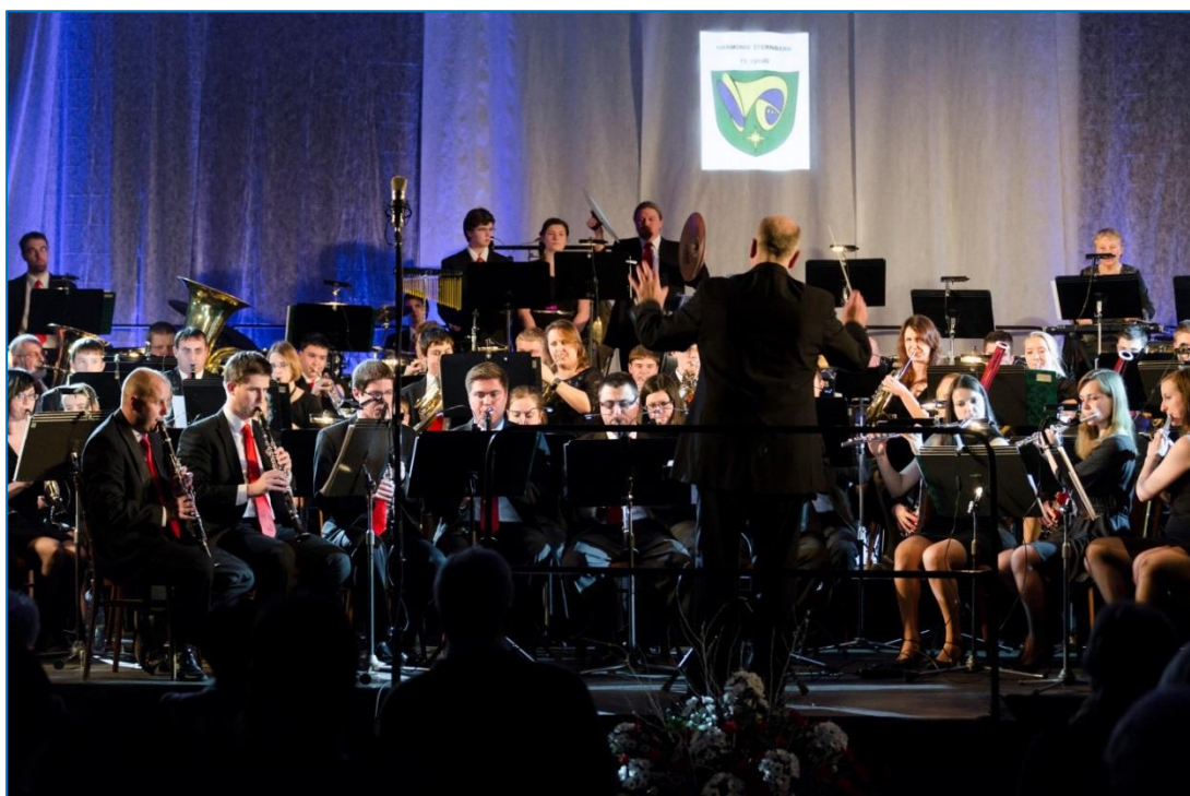
Jubilejní 15. galakonzert studentského orchestru Harmonie Šternberk

Zastupitelé odsouhlasili 10. prosince snížení poplatku za odpady z 600 na 550 korun. Gymnázium dokončilo rekonstrukci fasády a výměnu oken a dveří. 18. prosince byla ukončena rozsáhlá rekonstrukce ulic Masarykova, Krampolova a U Horní brány a tyto začaly opět sloužit šternberské veřejnosti. Na Jívavské a Olomoucké ulici byl zahájen zkušební provoz stacionárních radarů. Na jubilejním 15. galakonzertu studentského orchestru Harmonie Šternberk vystoupila zpěvačka Bára Basiková a pěvec Martin Zouhar. Ve městě účinkovali také v rámci adventních koncertů 4. prosince Hana a Petr Ulrychovi. Závěr roku 2014 oslavili obyvatelé města na Hlavním náměstí, k žádným mimořádným událostem v souvislosti s oslavami nedošlo.