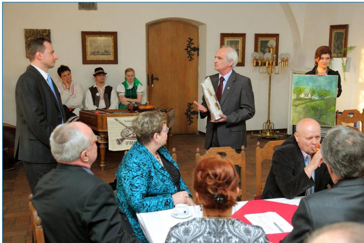
Slavnostní setkání delegací partnerských měst Dobšiná, Kobiór a Sajószentpéter na hradě