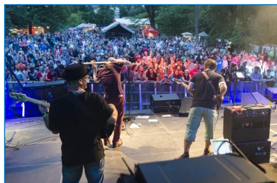
Rockový festival Šternberský kopec na hradě