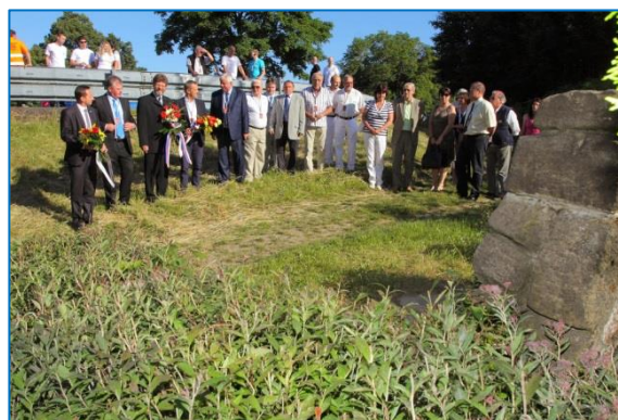
Ecce Homo 2014: start závodu, diváci na trati, vyhlášení výsledků na Hlavním náměstí, položení kytic k pomníku Bruna Sojky