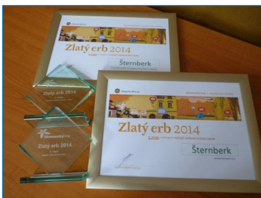
Zlatý erb pro Šternberk 2014

Tělocvičná jednota Sokol Šternberk si připomněla krásné 90. výročí od svého založení, slavnostní setkání proběhlo 21. března v prostorách hradu. Město zahájilo přípravy na zpracování nového strategického plánu města, proběhlo dotazníkové šetření mezi občany. Město získalo Zlatý erb za 2. místo v kategorii nejlepší webová stránka Olomouckého kraje. Radnice vyhověla požadavkům občanů a schválila svozy komunálního odpadu pouze do 18. hodiny, namísto do 22 hodin. Sociální služby Šternberk rozšířily nabídku o tzv. odlehčovací službu, jejímž cílem je umožnit pečující osobě nezbytný odpočinek, novou službu schválilo zastupitelstvo. Podnikatelská zóna Šternberk získala čestné uznání za podporu podnikání a přeměnu brownfieldu v rozvíjející se areál.