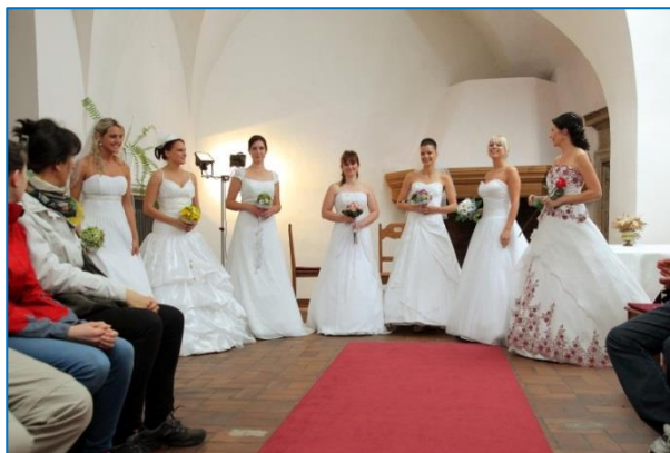
Svatební veletrh na hradě