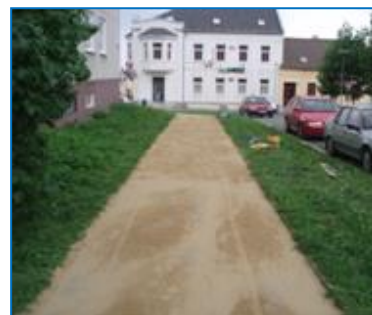
Workoutpark v Tyršových sadech, losování pořadí volebních stran do komunálních voleb, opravy chodníků Jiráskova