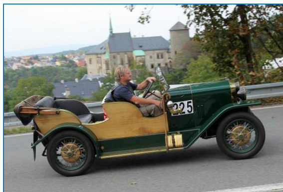
Ecce Homo Historic