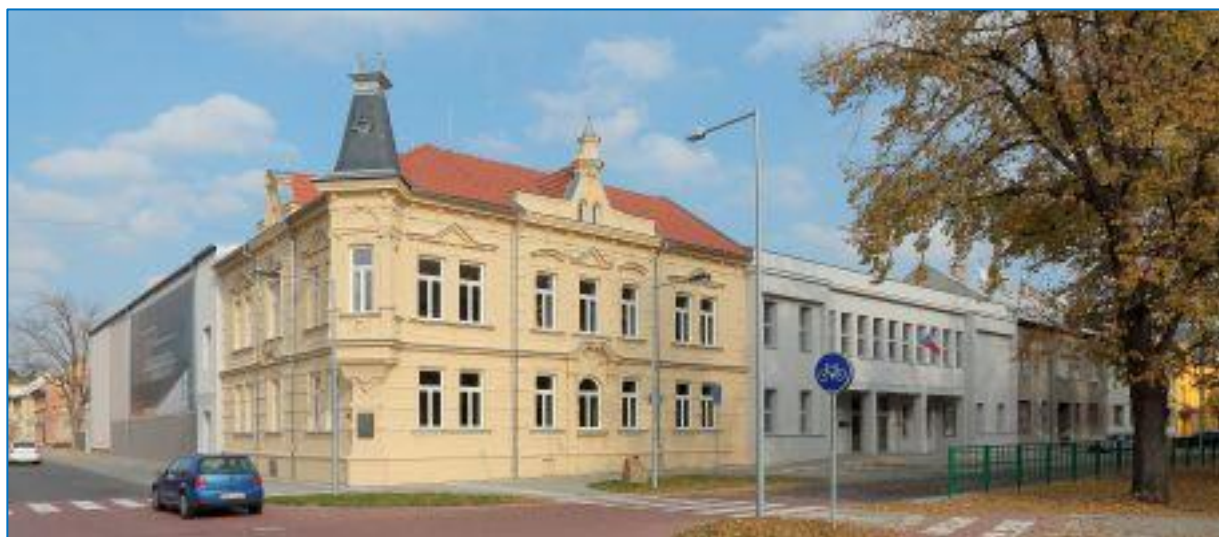
Kulturní dům po rekonstrukci