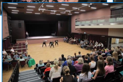
Ocenění sportovců v Kulturním domě