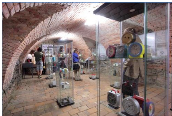
Nově otevřená výstava v Expozici času o hodinářské historii města