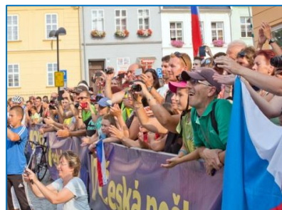
Czech Cycling Tour, královská etapa ve Šternberku