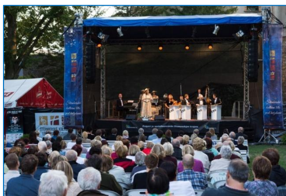
Šternberské kulturní léto pod hvězdami