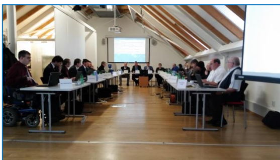
Zasedání zastupitelů 25.02.2015 v Expozici času

Občanům byly i v tomto roce nabídnuty k zapůjčení biopopelnice a kontejnery. V souvislosti se zavedením svozu bioodpadu byla také schválena změna tzv. svozových dnů, kdy se od dubna měl svážet komunální odpad a bioodpad jednou za dva týdny. Město pořídilo povodňový plán v digitální i tištěné podobě a zveřejnilo jej na svých internetových stránkách. Zastupitelé města deklarovali na svém zasedání 25. února příslib podpory sportu ve městě, zabývali se peticí za záchranu altánu v Tyršových sadech a souhlasili s přípravou koncepce využití altánu i celého parku.