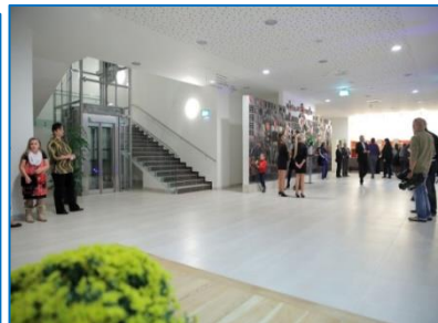
Slavnostní otevření Kulturního domu po rekonstrukci