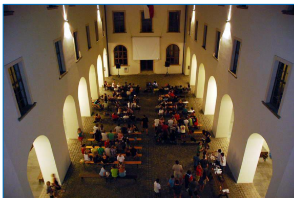
Letní kino v bývalém augustiniánském klášteře

Kulturou nabitý měsíc: na hradě probíhal třetí ročník Šternberského kulturního léta pod hvězdami, 15. července účinkovali pedagogové ZUŠ Šternberk s Letním nokturnem, 16. července vystoupila na hradě známá písničkářka Lenka Filipová. Území služebního obvodu Městské policie Šternberk bylo nově rozděleno do 12 okrsků, za každou oblast byl tak zodpovědný konkrétní strážník. Spolek Dalov pro život uspořádal v této místní části akci pro děti Pohádkový les a přispěl k oživení kulturního ruchu v obci. Městské koupaliště zažívalo díky horkému a slunnému počasí výbornou sezonu, probíhalo i večerní koupání. Padl teplotní rekord vody, kdy byla naměřena teplota 28,3 stupně, nejvíce za poslední sedm let. Extrémní teploty nalákaly na koupaliště i 1300 návštěvníků denně. Rekord na večerním plavání byl 237 lidí za jeden večer.