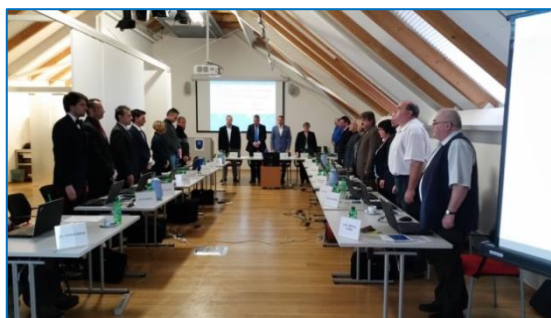
Minuta ticha k uctění památky obětí tragické události v Uherském Brodě