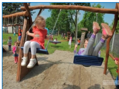
Nové přírodní hřiště MŠ U Dráhy