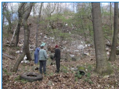
Uklíďme Česko v rámci akce Den Země