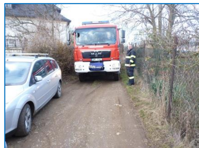
Hasiči při kontrole průjezdnosti komunikací