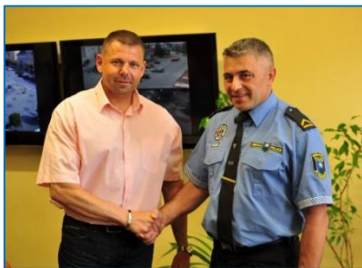
Vlevo nový velitel městské policie