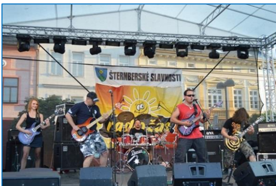
Šternberské slavnosti na Hlavním náměstí