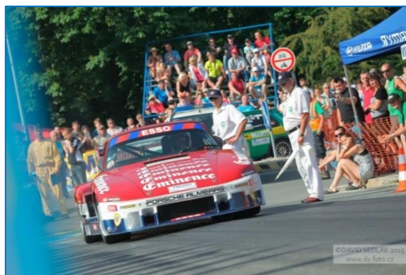
35. ročník ME Ecce Homo