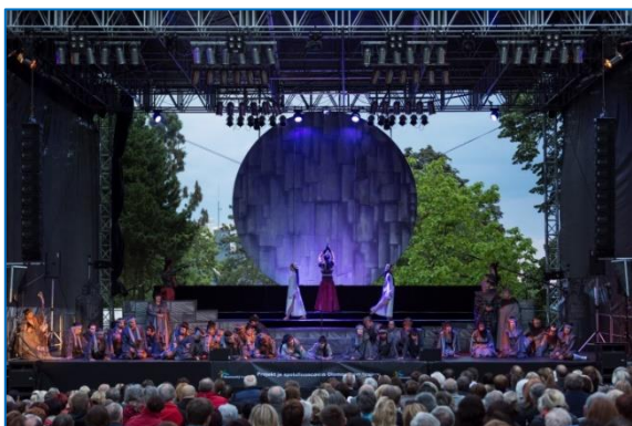
Opera Turandot na hradě