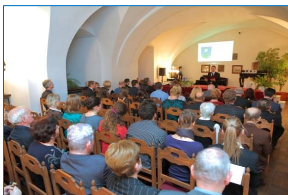
Slavnostní předání Cen města Šternberka za rok 2015 na hradě