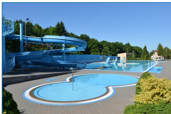
Městské koupaliště ve Šternberku