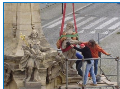
Socha svatého Rocha se po restaurování vrátila opět na své místo