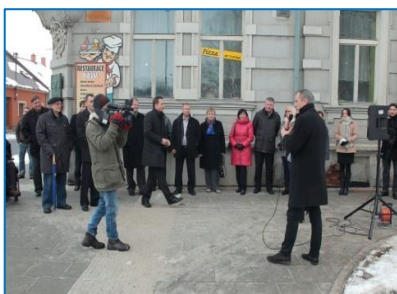
Otevření Masarykovy ulice 26.01.2015