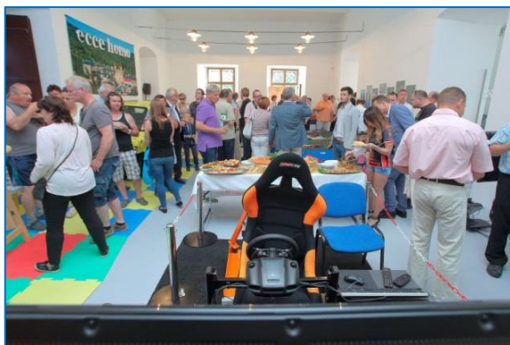
Slavnostní otevření nového Ecce Homo Parku v prostorách bývalého augustiniánského klášteře