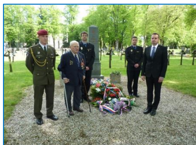
Městský hřbitov 8. května 2015

Radary již odchytily tisíce neukázněných řidičů, průměrný počet překročení rychlosti byl více než 120 za 24 hodin. Město zveřejnilo výsledky dotazníkového šetření na téma bezpečnost a porovnálo údaje z let 2009 a 2013, kdy šetření také probíhalo. Úspěšně byl ukončen projekt tzv. prostupného zaměstnávání, jehož cílem bylo řešit situaci osmi sociálně vyloučených spoluobčanů. Děti z mateřské školy U Dráhy dostaly úplně nové přírodní hřiště, realizace stála celkem 960 tisíc korun. Již po sedmé se ve městě uskutečnil festival pěveckých sborů Šternberk zpívá v bývalém augustiniánském klášteře. Šternberští fotbalisté oslavili 70. výročí založení fotbalového klubu ve městě. Altán v parku byl zapsán z rozhodnutí Ministerstva kultury do seznamu kulturních památek. V pátek 8. května jsme si na městském hřbitově připomněli 70. výročí od konce 2. světové války. Šermíři TJ Sokol Šternberk David Kvapil a Vladimír Knob získali cenné medaile na turnaji Mostecký fleret. 25. května zemřel ve věku 85 let bojovník a nadšený skaut pan Jaromír Rozsypal.