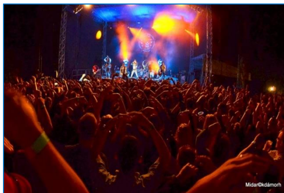
Festival Šternberský kopec na hradě