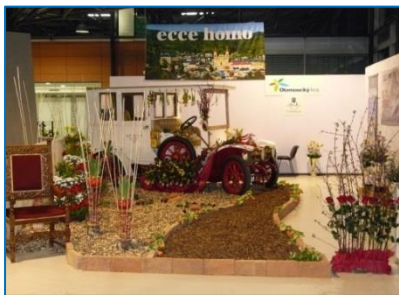
Prezentace města na Floře Olomouc