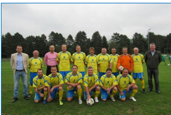
Turnaj partnerských měst Old boys ve Šternberku, tým Šternberka