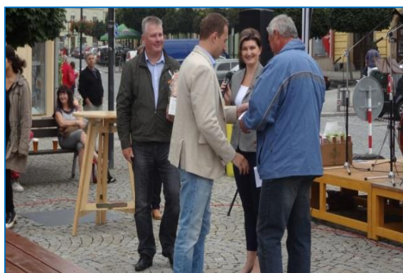
Vyhlášení výsledků květinové soutěže na Hlavním náměstí