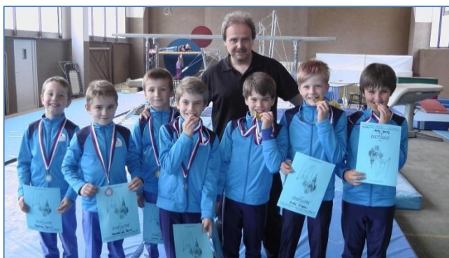
Úspěšní šternberští gymnasté TJ Sokol Šternberk