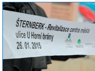
Otevření ulice U Horní brány 26.01.2015