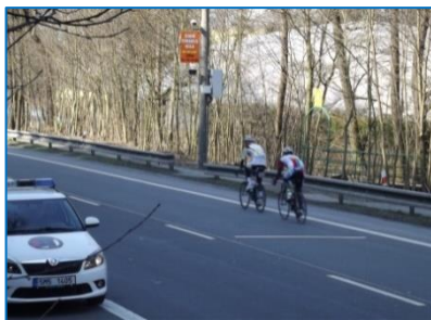
Radar na ulici Jívavské