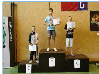
Úspěšní šermíři TJ Sokol Šternberk