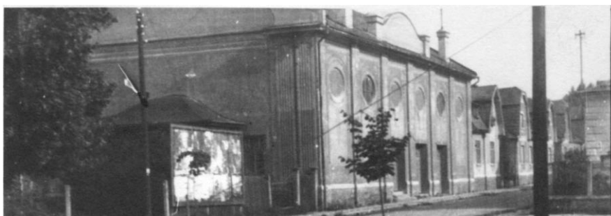
Saxingerovo kino na konci 2. světové války.

„Necht' posoudí po odstupu časovém budoucí, že to bylo učitelstvo, které živilo svou prací – bez nadsázky – celé živobytí života sociálního, kulturního i hospodářského v místě a kraji – nejpodstatněji – až do oběti vlastních osobností – i za cenu klidu a zdraví.“