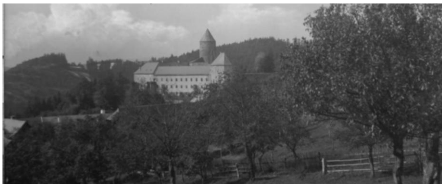
Školní výlety mířily rovněž na hrad Slovinec.

„Tak dostalo české Šternbersko ústav, který bude novým zdrojem kulturního záření pro celý kraj a významnou posilou české národní obnovy pod Jeseníky.“