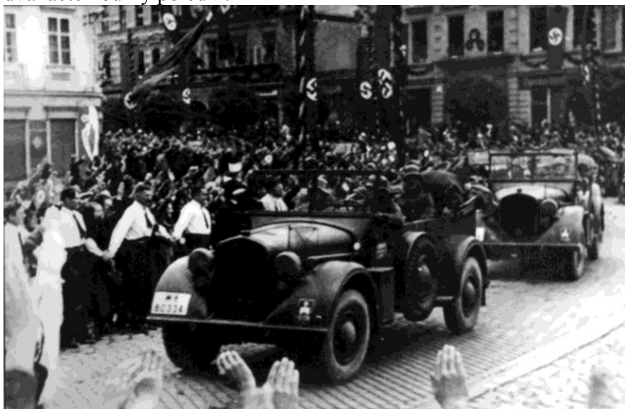
Obsazení města německou armádou.