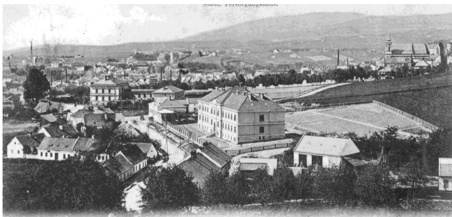
Budova gymnázia v roce 1909.

„...tam, kde Matice založila střední školu, vytvořila také dobrou základnu nového, rušnějšího a rozvítěžšího života kulturního, národního i hospodářského. Nová střední škola stávala se požehnáním a posilou pro celý kraj. Tak tomu bývalo v době národní nepohody. Ale toto poslání má Matice dosud; neboť opět je nutno sahati k svépomoci tam, kde nestačí prostředky státní. Matice zasahuje do hraničářského školství, zakládá a připravuje nové školy, doplňuje státní prostředky, aby se naléhavým potřebám národního pohraničí vyhovělo snáze a rychleji. Proto také s nastávajícím školním rokem otvírá nové čtyři střední školy, mezi nimi i ústav zdejší.“