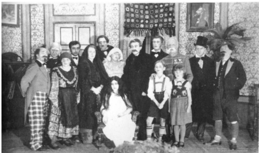
Divadelní hra „K. H. Borovský“ v provedení šternberských ochotníků. obr. 19

Kromě exkurzí se žáci měšťanky rozjeli do Olomouce na představení cirkusu Gleich. Svátek matek slavila obecná a mateřská škola programem v Národním domě (děti pak rozdaly maminkám srdíčka zhotovená v ručních pracích výchovných), měšťanská škola akademií.