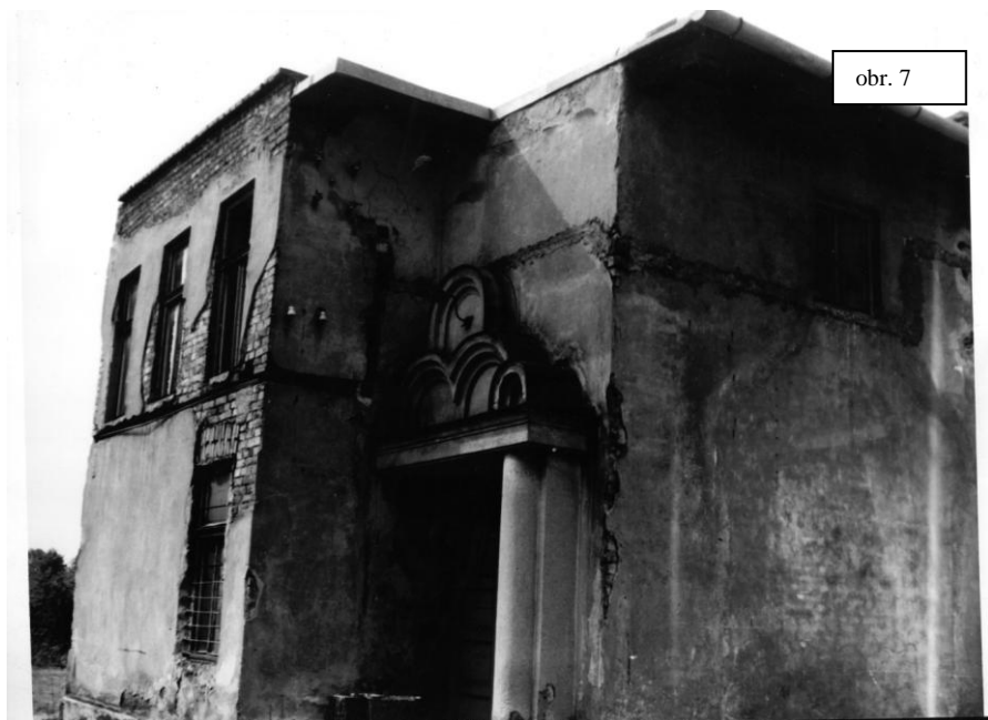
Jediný snímek dvorany Národního domu, který se podařilo opatřit, je z demolice této budovy, snad počátkem osmdesátých let minulého století.

Deštivý podzim pak kritikům jakoby dával zapravdu. Často pršelo, vytápění a vysušování místností zvýšilo nečekaně náklady.