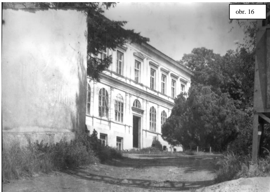
Budova německé tkalcovské školy, kterou se marně snažila získat česká menšina.

„Tímto školním rokem bylo zakončeno 1. desetiletí české školy ve Šternberku; vliv školy je nesporně znatelný v každém směru. Kéž práce i v dalším období přispěje ku vzrůstu a rozvoji české školy, jejímž úkolem mimo jiné jest, aby splňovala se věštba Komenského i v poněmčeném Šternberku: Vláška věcí tvých vrátí se zas k Tobě, lide český!“