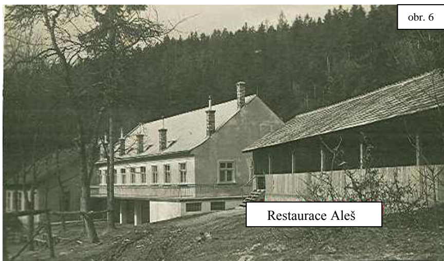
Další z cílů školních výletů žáků českých škol.

Kéž rok příští přispěje opět ku rozvoji české školy a tím zároveň ku rozvoji české menšiny šternberské. Nazdar!“