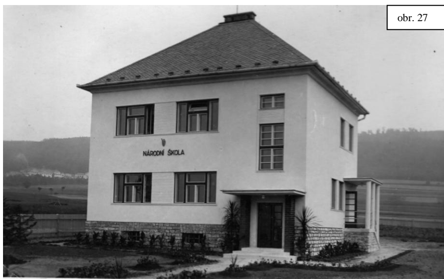
Česká škola v Pasece.

13. srpna byla slavnostně otevřena nová budova hraniční školy v Pasece...“ ( A 30. srpna ve Valšově. )