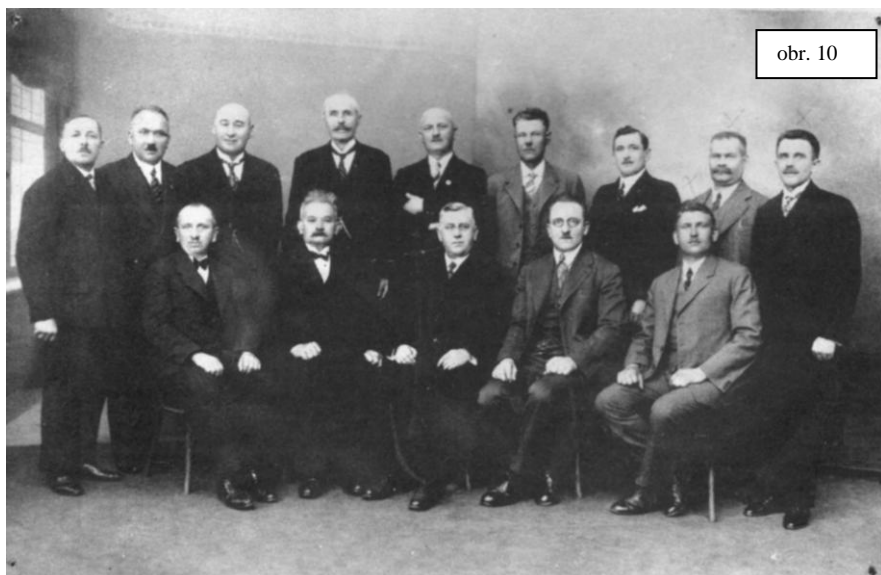
Družstvo Národního domu ve Šternberku.

V druhé polovině července se počaly kopat základy. Ovšem po nových bojích, majitelé pozemku kladli odpor, chtěli prodat pouze malou část pozemku. Počítalo se s tím, že se tu začne učit 1. září 1925. Věřilo se, že budou konečně odstraněny všechny překážky nerušeného rozvoje zdejšího školství.