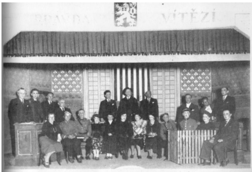
Z divadelní hry „Je Mary Duganová vinna?“

Za rok se přečetlo průměrně 15 knih (celkem 2 626).