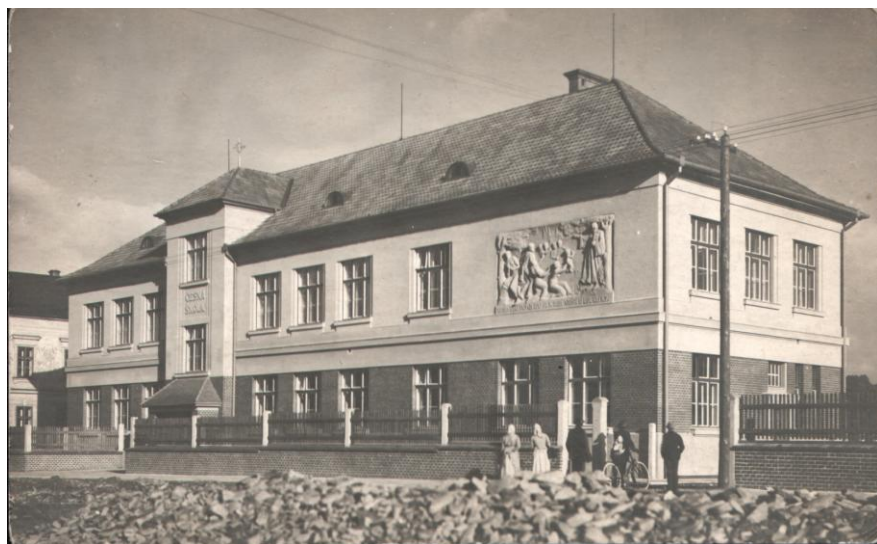
Nová budova první české obecné školy

„...postavením školní budovy počínají se splňovati všetecká slova Komenského, napsaná pod reliéfní výzdobou na jižním průčelí budovy: Vláda věcí tvých zas se k tobě vrátí, ó lide český... Ano, vrátí se i zde ve zněmčelém Šternberku, budou-li všichni nadšenci k tomuto cíli pracovati, proniknutí jsouce láskou k vlasti, láskou k národu. Práce a lásky je potřebí k dosažení tohoto cíle. Nazdar!“