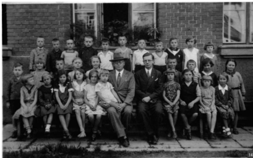
Na fotografii uložené v SOKA Olomouc je uvedeno, že se jedná o třídu české školy ve Šternberku z roku 1932. obr. 21

byli třikrát v Olomouci v divadle: na Psohlavcích, Snu noci svatojanské a Svatém Antoníčkovi.