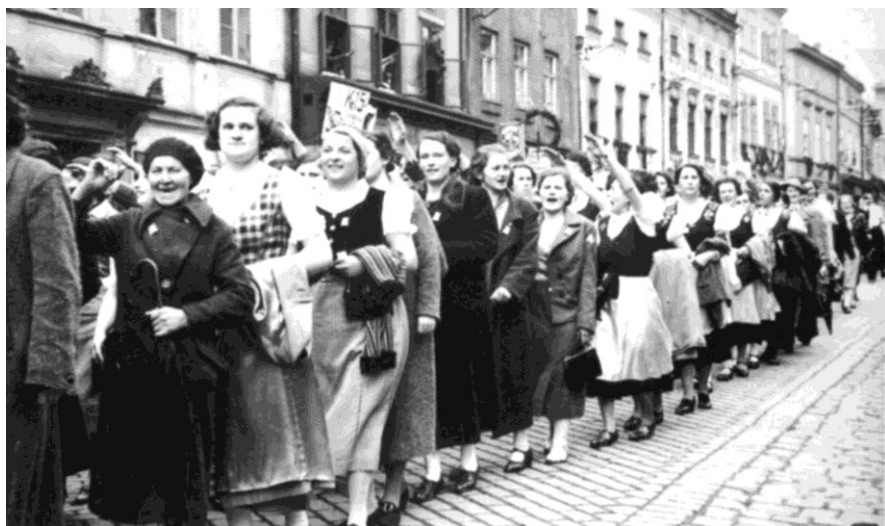
Německé obyvatelstvo při květnových volbách v roce 1938.