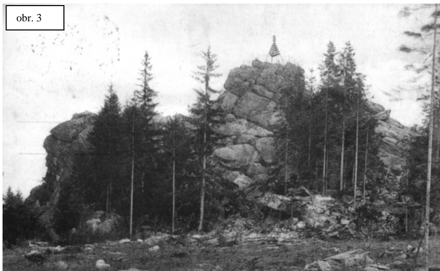
Bradlo u Hradečné. Místo setkávání českých menšin severní Moravy, později častý cíl školních výletů.