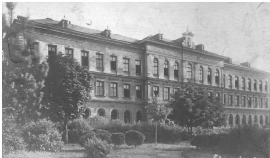
Budova německé školy obecné a měšťanské, kde v září 1922 začalo vyučování 1. ročníku české školy měšťanské v pronajatých místnostech. obr. 8