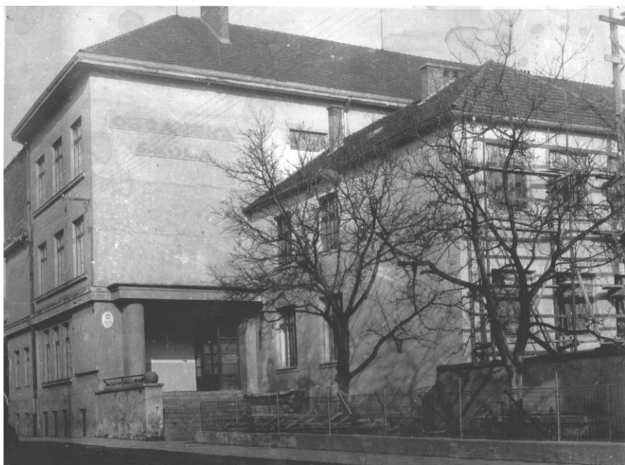
Česká měšťanská škola.

Finanční likvidace ústavu byla ukončena v únoru 1939, věcná na podzim 1939. Soupis škod vzniklých obsazením šternberského ústavu byl vypočten na 562 933 Kč, mimo věci přivezené do Olomouce. Inventáře pomůcek a vnitřního zařízení byly odvedeny zemské školní radě v Brně, archiv byl odevzdán ředitelství státního dívčího reformního gymnázia v Olomouci, čímž byla dne 22. ledna 1940 provedena konečná likvidace šternberského ústavu.