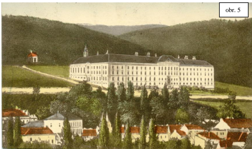
Klášter na kolorované pohlednici z roku 1908.