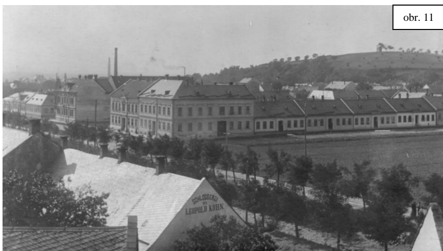
Na obrázku je pozemek před zahájením stavby první české školy v roce 1921.

„Rok tento plynul celkem normálně... Prací ve škole i činností mimoškolní upevňuje se pozice české menšiny rok od roku zřetelněji. Škoda, že v životě veřejném není více svornosti a lásky mezi hraničáři, tak jak bývalo zde v prvých letech po převratu! Vzájemná nevraživost vznikající z rozdílů politických, náboženských, stavovských hlodá jako červ na společných zájmech Čechů v zněmčeném prostředí. Snad budoucnost zjedná i v tomto směru návrat k lepšímu!“