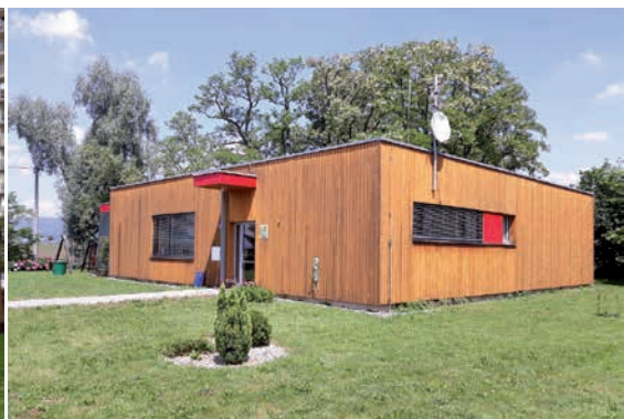
Domov se zvláštním režimem - Lužice 12, Lužice