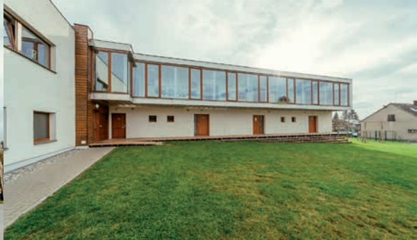
Azylový dům - Bydlení pro matky / otce s dětmi v tísni