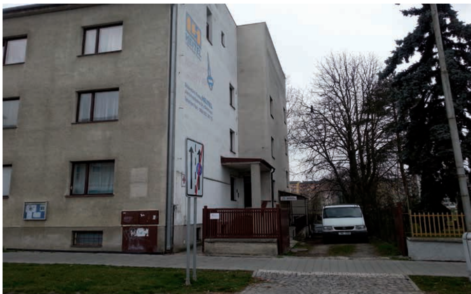
Společnost pro ranou péči, pobočka Olomouc. Regionální centrum pro podporu a provázení rodin dětí se zrakovým a kombinovaným postižením (Střeni novosadská 356/52)