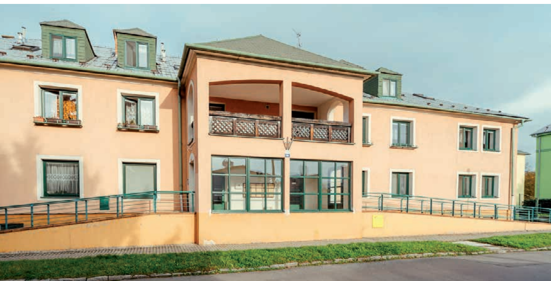
Sídlo příspěvkové organizace Sociální služby Šternberk