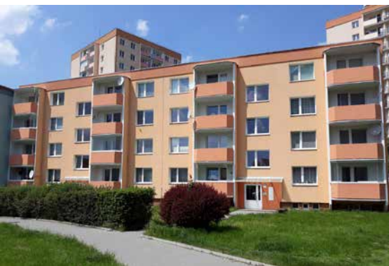
Chráněné bydlení Nádražní 1693, Šternberk