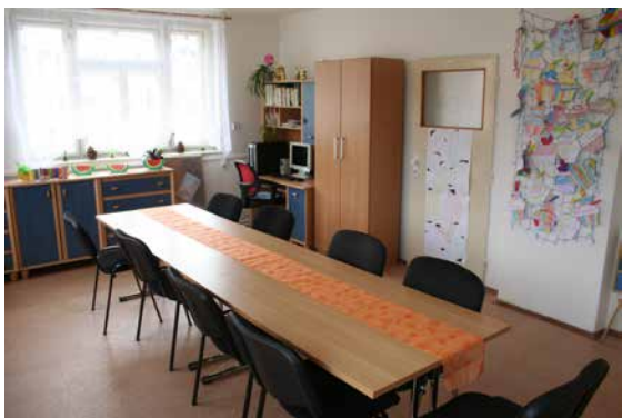
Sociálně aktivizační služby pro rodiny s dětmi – Centrum pro rodinu, děti a mládež