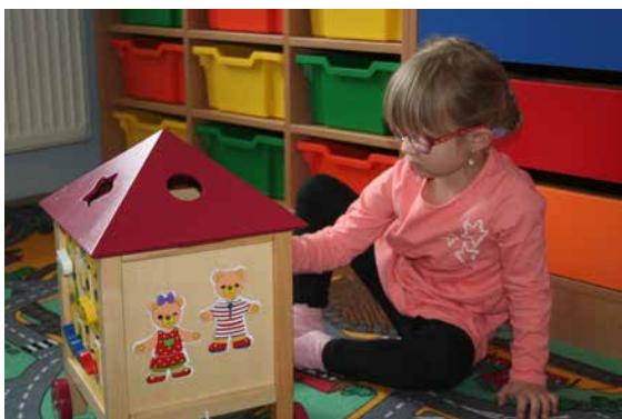
Dětská skupina Dráček, Skřítek Šternberk