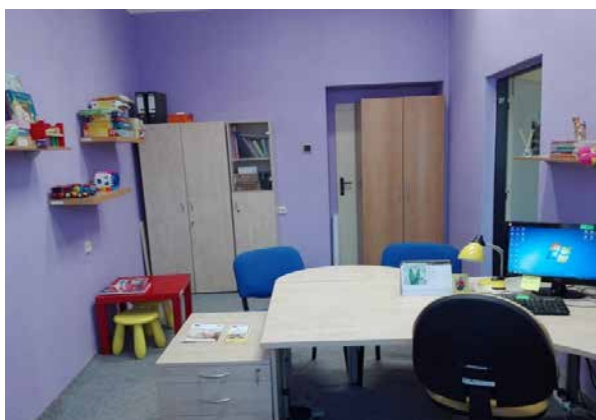
Pracoviště ambulantní formy služby