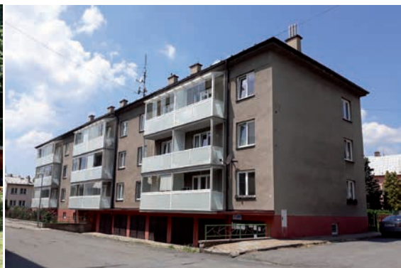
Chráněné bydlení - Za Zahradami 1769, Šternberk