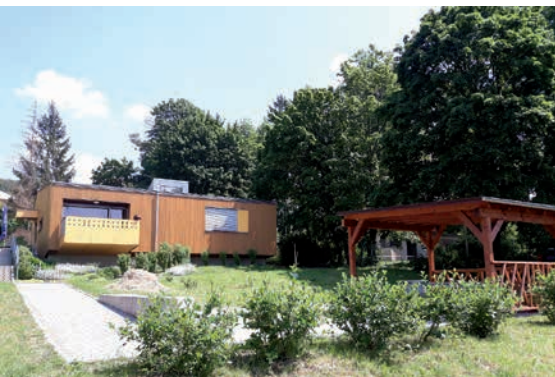
Domov se zvláštním režimem - Opavská 2632, Šternberk