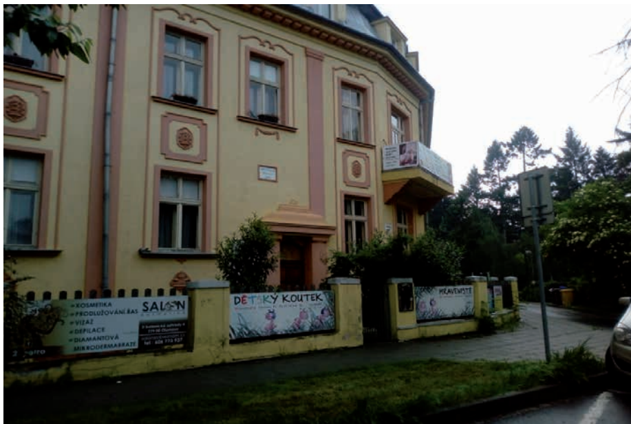
Společnost pro ranou péči, pobočka Olomouc. Regionální centrum pro podporu a provázení rodin dětí s tělesným, mentálním a kombinovaným postižením (U Botanické zahrady 828/4)