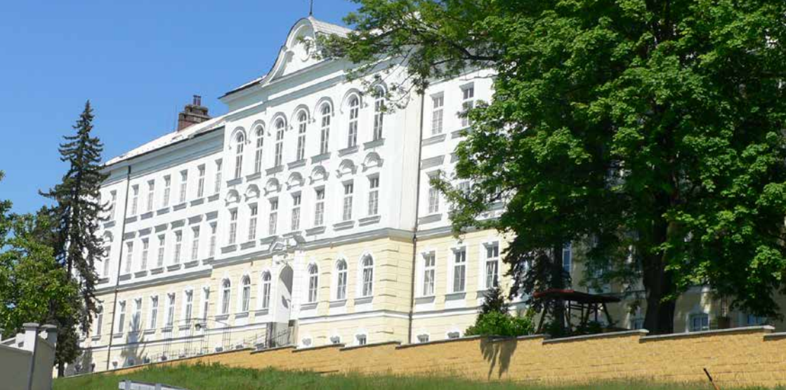
Domov pro osoby se zdravotním postižením- Sadová 1426, Šternberk