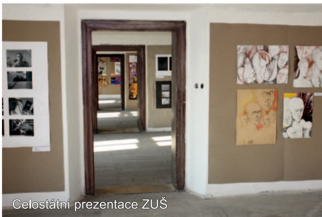
Celostátní prezentace ZUŠ