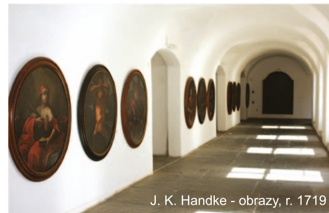
J. K. Handke - obrazy, r. 1719