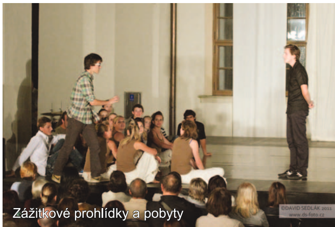
Zážitkové prohlídky a pobyty