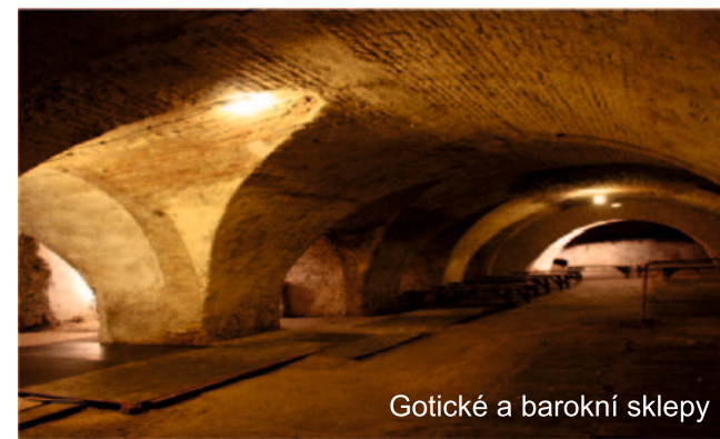
Gotické a barokní sklepy