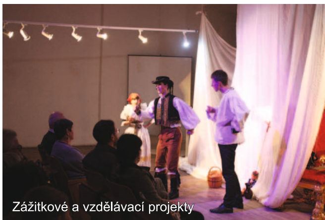
Zážitkové a vzdělávací projekty