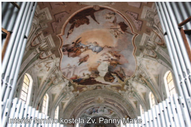
Interiér farního kostela Zv. Panny Marie