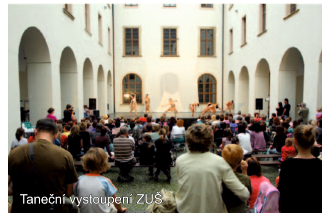
Taneční vystoupení ZUŠ

Handkeho spolek, město Šternberk a Římskokatolická farnost Šternberk Vás zvou na zážitkové prohlídky klášterních sklepů, historických sálů, monumentálního kostela a výstav současných autorů. Dále nabízíme zážitkové pobyty - info na: www.handke.cz .