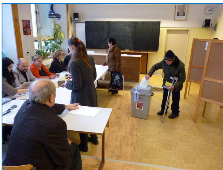
Přímá volba prezidenta České republiky