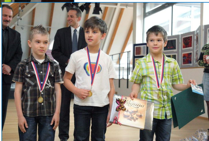
Ocenění gymnasté TJ Sokol Šternberk