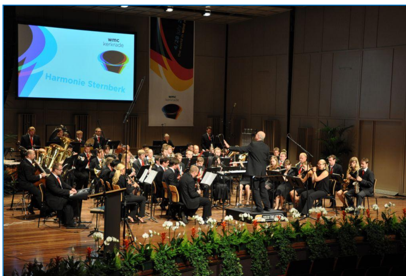
Harmonie Šternberk v Kerkra