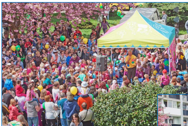
Slavnostní představení nového Rákosníckova hřiště na Nádražní ulici