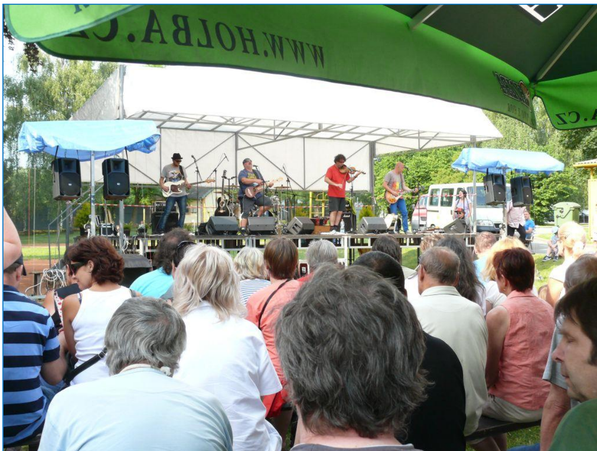
Léčebenské slavnosti 2013 u příležitosti 120. výročí založení léčebny ve Šternberku