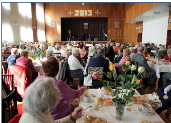
Setkání se seniory v Městském klubu