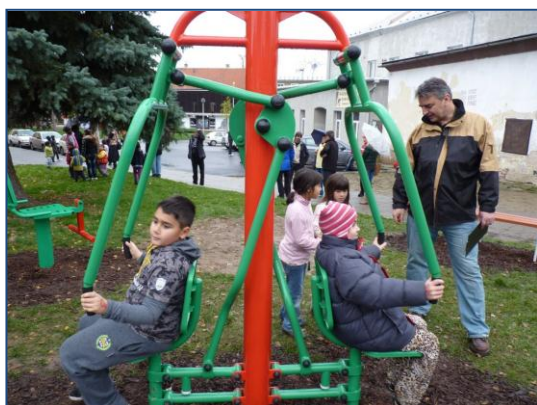
Venkovní posilovna na Olomoucké ulici