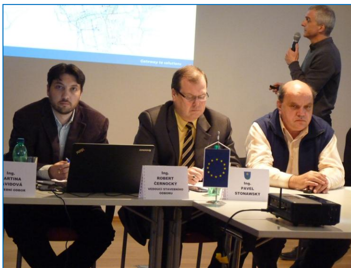
Představení nového územního plánu města v Expozici času