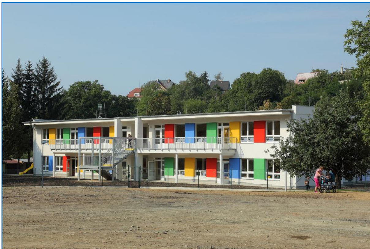
Nová mateřská škola na Světlově; hejtmán Olomouckého kraje Jiří Rozbořil předává symbolický klíč ředitelce Ivě Kráčmarové

Veřejnost se mohla v sobotu 31. srpna podívat do nově postavené mateřské školy na Světlově. Slavnostního otevření se zúčastnil také hejtmán Olomouckého kraje Jiří Rozbořil. Stavba školky stála 24,8 milionu korun, vybavení přišlo na 2,5 milionu korun. Nová mateřská škola byla největší investiční akcí roku 2013. Celkem osm uživatelů šternberského Vincentina získalo nové bydlení v samostatných zrekonstruovaných bytech v běžné zástavbě města. Slavnostního otevření a předání klíčů se zúčastnil také starosta Stanislav Orság. Místní organizace Českého svazu chovatelů uspořádala poslední srpnový víkend tradiční výstavu drobného zvířectva ve Lhotě, navštívilo ji cca 1000 lidí.