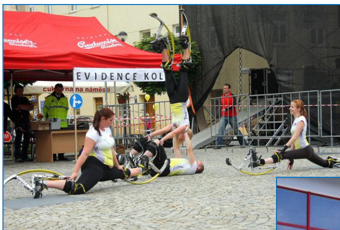
Město v pohybu na Hlavním náměstí