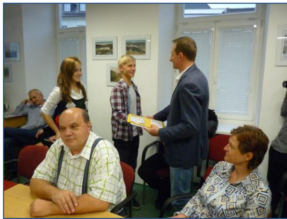
Děti předávají starostovi dopravní studii Na zelenou