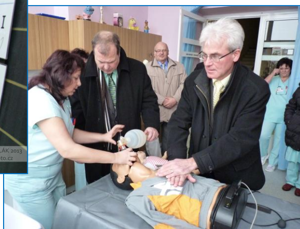
100. výročí založení Nemocnice Šternberk