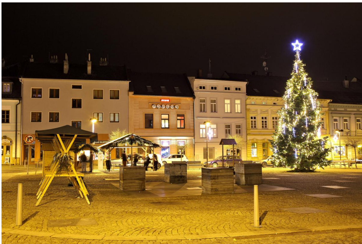
Vánoční atmosféra na Hlavním náměstí ve Šternberku

Zpracovala: Mgr. Irena Černocká vedoucí oddělení personalistiky a vnějších vztahů tisková mluvčí leden 2014