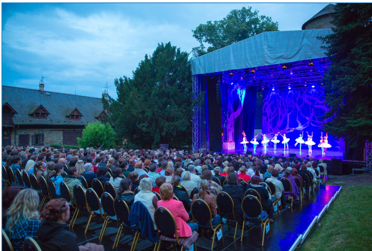
Labutí jezero v areálu Státního hradu Šternberk

Kulturou nabitý měsíc: na hradě probíhal první ročník Šternberského kulturního léta pod hvězdami, 11. července se zde Moravské divadlo Olomouc představilo open air baletním představením Labutí jezero. Světový úspěch zaznamenal dechový orchestr ZUŠ Harmonie Šternberk, který se ve dnech 12. – 14. července zúčastnil světové soutěže dechových orchestrů v holandském městě Kerkrade a tuto soutěž vyhrál. Orchester získal nejvyšší ocenění jaké lze na této soutěži dosáhnout: zlatou medaili s vyznamenáním. 20. července se stal hrad místem konání již 10. ročníku hudebního rockového festivalu Šternberský kopec, na kterém vystoupila pro několik tisíc návštěvníků legendární Boney M. 13. července projel městem etapový cyklistický závod Czech Cycling Tour, Šternberk bylo součástí třetí, tzv. královské etapy.