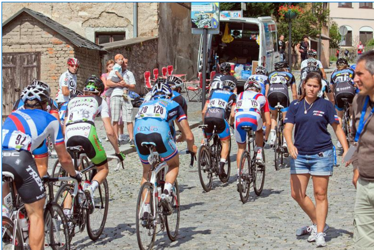
Etapový cyklistický závod Czech Cycling Tour projel Šternberkem