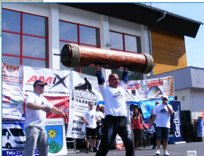
Strongman 2014 u sportovní haly Ecce Homo