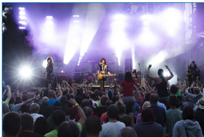
Festival Šternberský kopec v areálu Státního hradu Šternberk