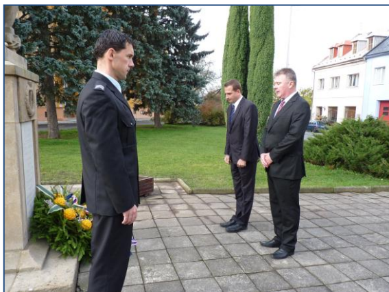
Pietní akt na náměstí Svobody