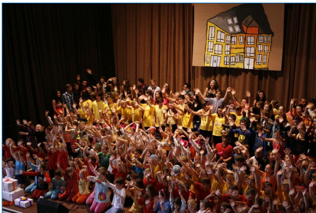
Oslavy 90. výročí první české školy ve Šternberku: Základní školy Dr. Hrubého.