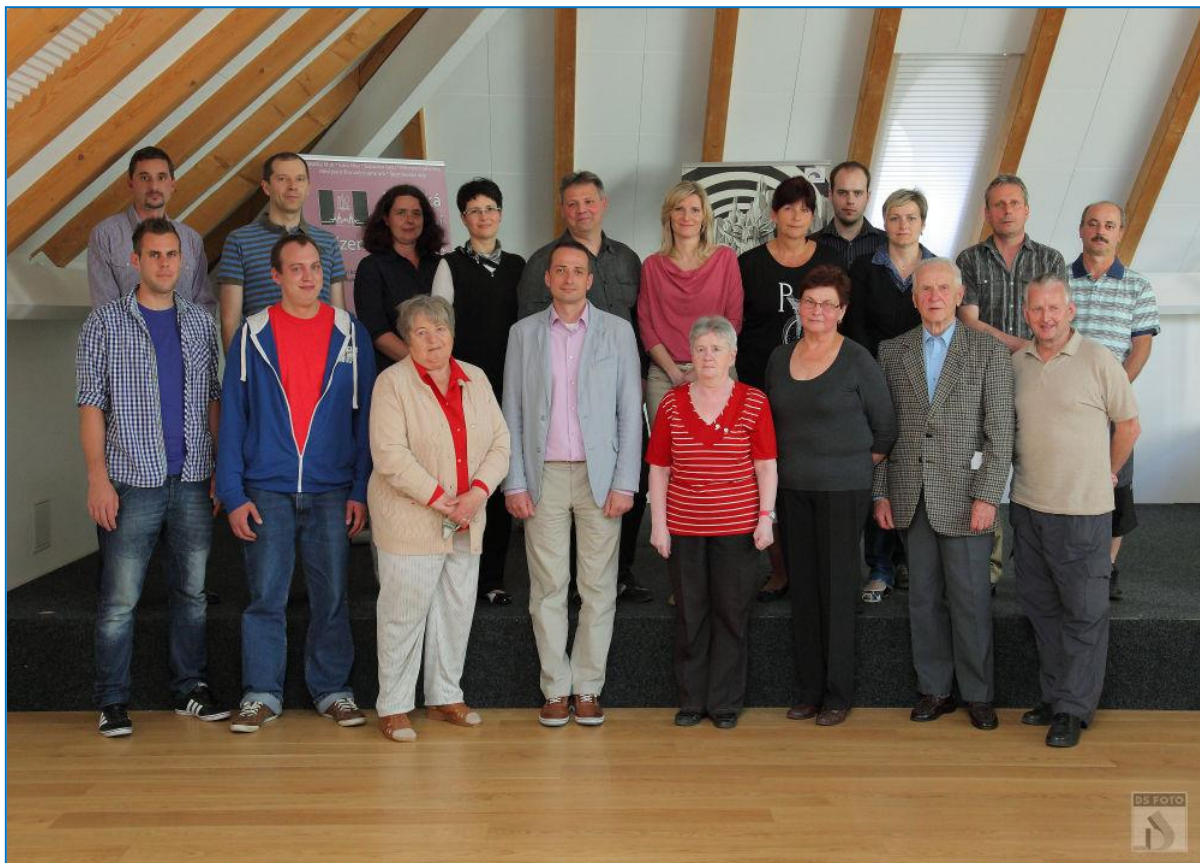
Ocenění dobrovolní dárci krve se starostou v Expozici času