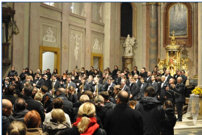
Dny rodu Šternberků, koncert v chrámu Zv. Panny Marie