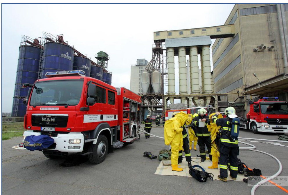
Cvičení složek integrovaného záchranného systému v areálu firmy MJM Litovel a.s. ve Šternberku