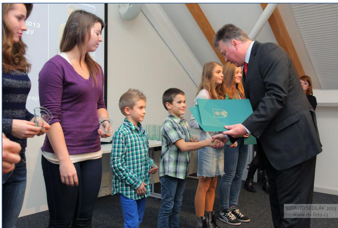
Slavnostní vyhlášení sportovce, trenéra, družstva roku v Expozici času