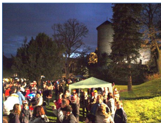
Svatý Martin na Státním hradě Šternberk