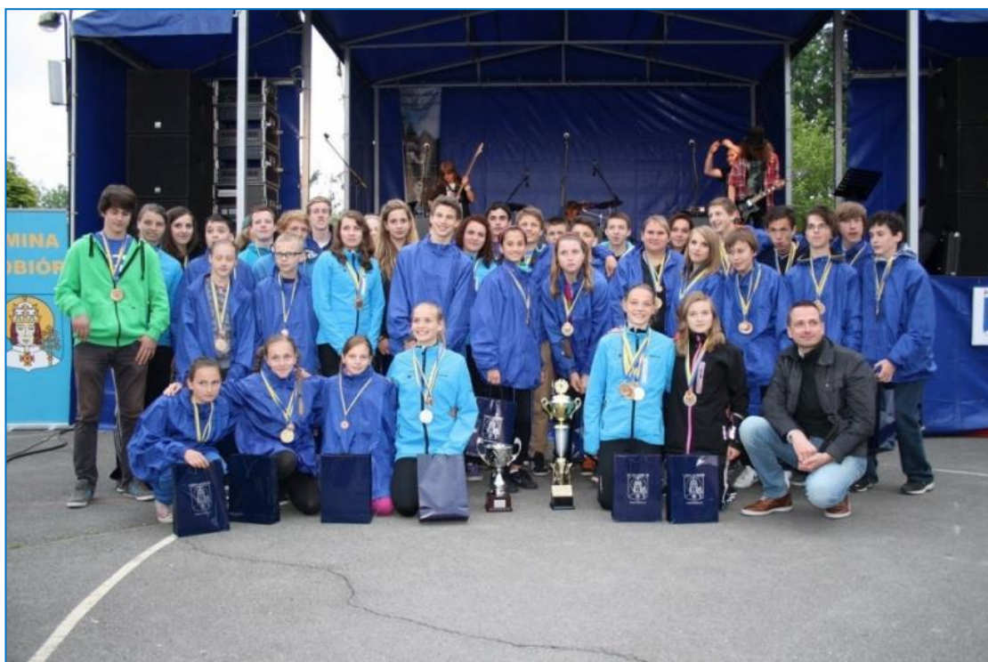
Vítězní sportovci našich základních škol na XII. ročníku Mezinárodních sportovních her v polském partnerském městě Kobióru