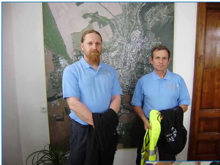
Asistenti prevence kriminality