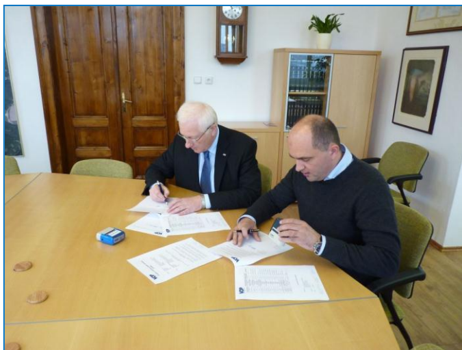
Nový majitel VOP CZ - Excalibur Army, podpis smlouvy