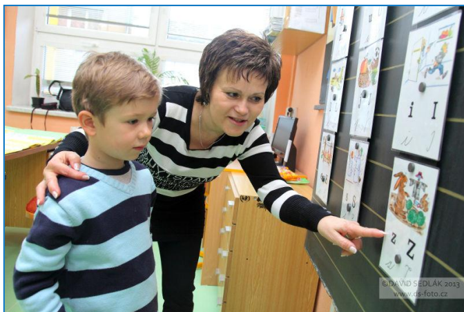
Zápis dětí do prvních tříd základních škol

Šternberk měl k 1. lednu 13.681 obyvatel. Prvním šternberským miminkem roku 2013 narozeným ve šternberské porodnici se stal chlapec Matěj Stejskal, který přišel na svět 4. ledna. 5. ledna proběhla ve městě Tříkrálová sbírka, vynesla 130 tisíc korun. Nemocnice Šternberk si připomněla 100. výročí od jejího založení. Město obhájilo certifikát řízení kvality dle ČSN ISO 9001:2009 a starosta Stanislav Orság převzal 14. ledna dokument potvrzující kvality vedení a chodu městského úřadu. Rok se nesl ve znamení významných investičních akcí: stavby nové mateřské školy na Světlově, přípravy rekonstrukce Městského klubu, nového územního plánu města a investic v dopravě. K historicky první přímé volbě prezidenta České republiky přišlo ve Šternberku 55,83% voličů, obě kola voleb ovládl ve městě Miloš Zeman, který se stal novým českým prezidentem. K zápisu do prvních tříd základních škol přišlo 214 dětí, což bylo o 22 více než v roce 2012. 23. ledna projeli městem účastníci dálkového závodu historických automobilů Winter trial 2013. Koulař Ladislav Prášil se nominoval na halové mistrovství Evropy. Společnost Remit s.r.o. zavedla dvousměnný provoz při svozu komunálního odpadu. Ve městě začala působit Agentura pro sociální začleňování, její hlavní náplní je předcházet projevům společenské nesnášenlivosti ve městě.