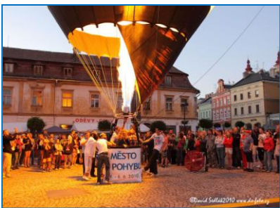
Město v pohybu