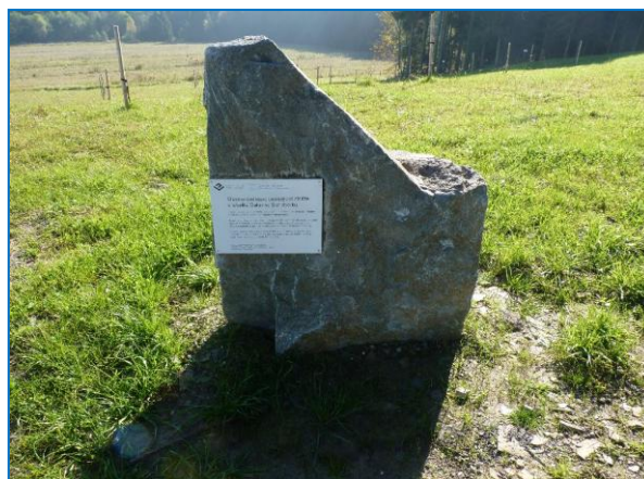
Ukončení likvidace nelegální skládky v Dalově, pamětní kámen