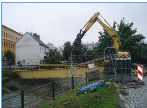
Demolice mostu přes Sítku 27. května