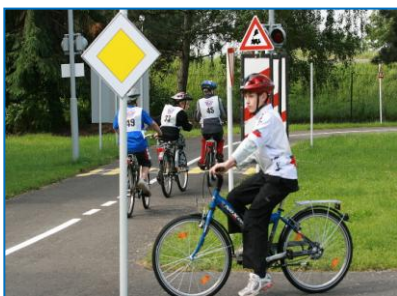
Celostátní soutěž mladých cyklistů