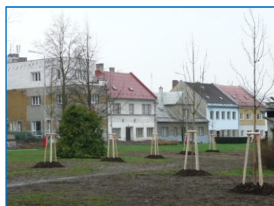
Nová výsadba ve Šternberku ulice Olomoucká a Nádražní