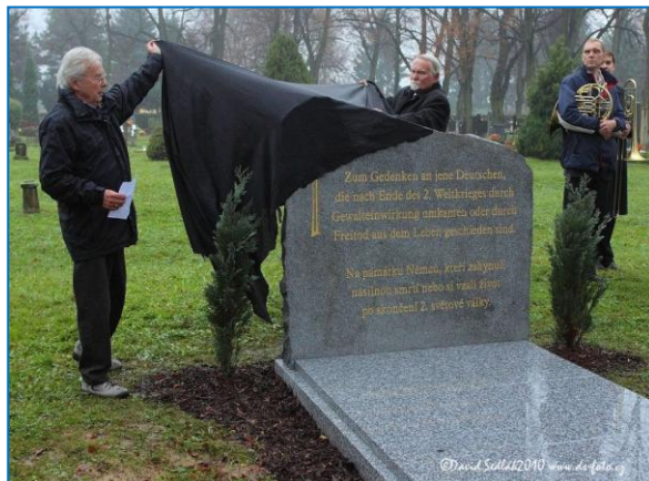
Slavnostní odhalení památníku civilním obětem po II. světové válce na městském hřbitově ve Šternberku