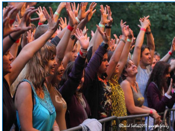
Atmosféra na festivalu Šternberský kopec v areálu Státního hradu Šternberk