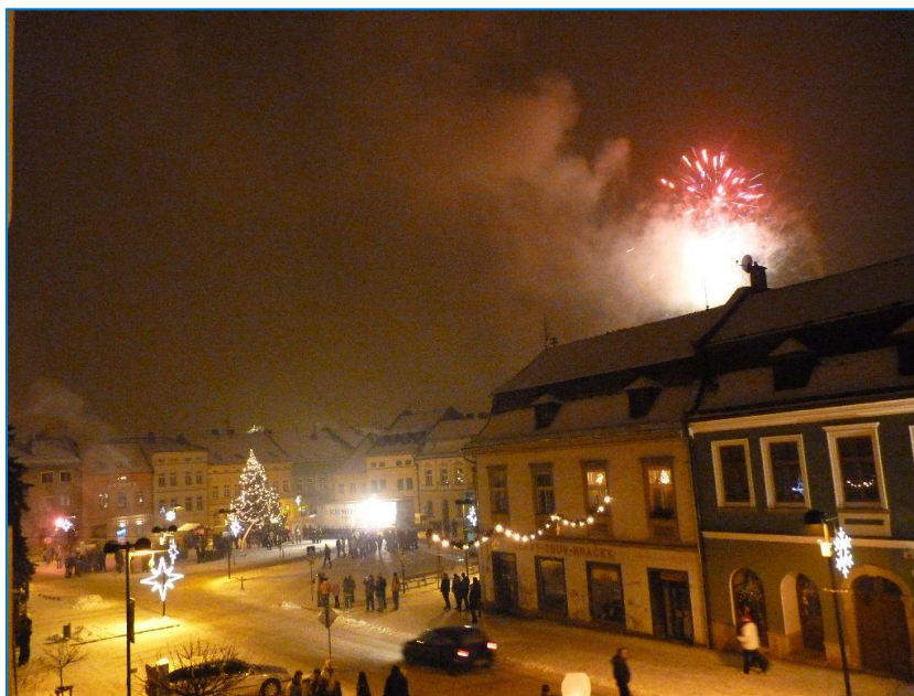
Hlavní náměstí 1. ledna 2011

Zpracovala: Mgr. Irena Černocká vedoucí oddělení personalistiky a vnějších vztahů odboru kancelář starosty tisková mluvčí červen 2011