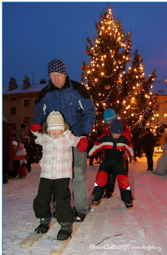
Vánoční atmosféra na Hlavním náměstí