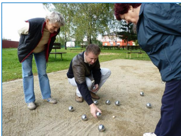
Nové pétanquové hřiště na Uničovské ulici