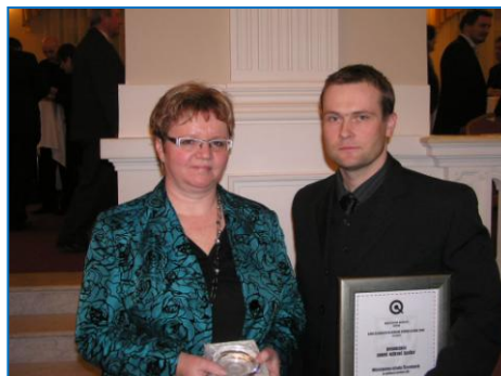
Cena za kvalitu ve veřejné správě