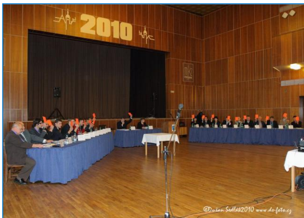
Ustavující jednání Zastupitelstva města Šternberka