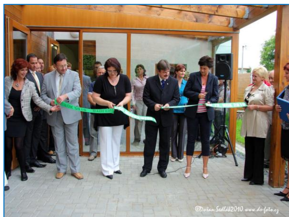
Slavnostní otevření Domu pro matky/otce s dětmi v tísní ve Šternberku- Dalově