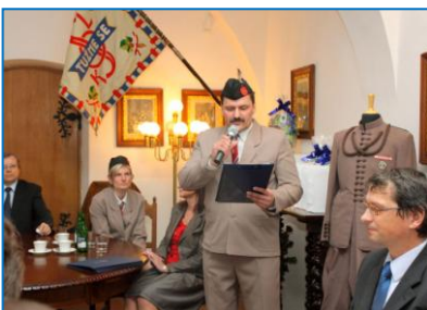
Oslava 85. výročí Sokola Šternberk