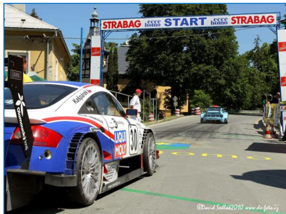
30. ročník ME Ecce Homo Šternberk