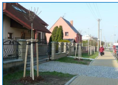
Nová výsadba na Nádražní ulici