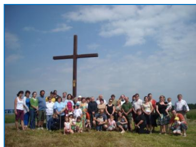
Vysvěcení kříže v Dalově