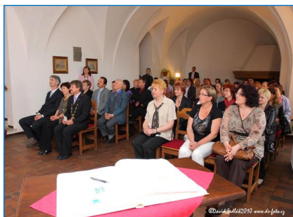
Ocenění dárce krve a zaměstnanci Sociálních služeb Šternberk