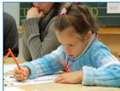
Zápis dětí do 1. tříd základních škol