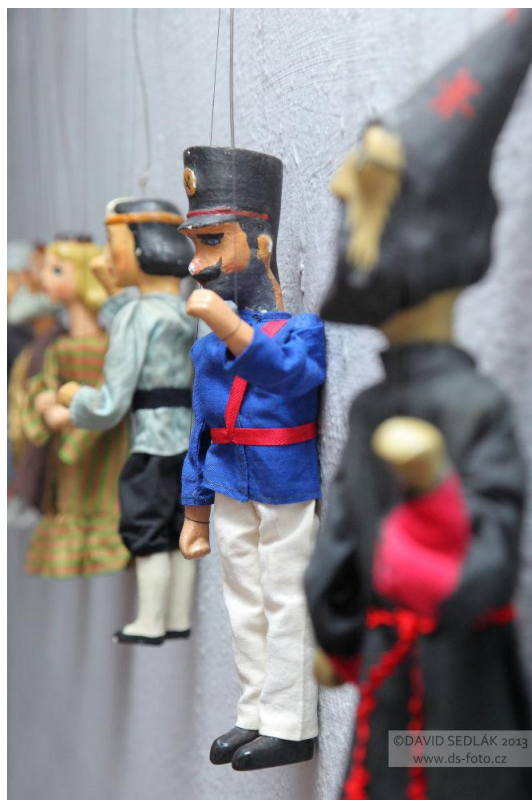
z výstavy (loutky zapůjčilo Vlastivědné muzeum v Olomouci)