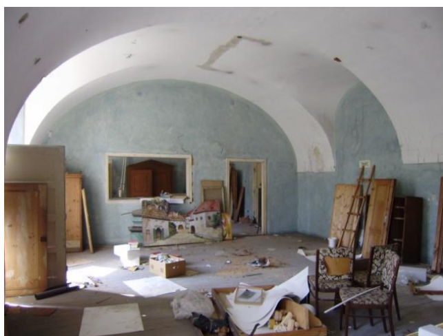
Původní stav místnosti, budoucí loutkové scény

Místnost, která svým členěním a uspořádáním přímo vybízí k zařízení jeviště a hlediště pro malé diváky loutkového divadla, má díky klenbám dobrou akustiku. Vstup do ní je přímo z chodby, kde je instalována výstava loutek a kulís. Prostor je příčkou s vhodným otvorem na jeviště rozdělena na dvě části – větší pro hlediště s kapacitou asi 30 dětí a 20 dospělých, menší – zázemí pro herce. Je možné kombinovat i se scénou, přímo před diváky živí herci vodí loutky, marionety.