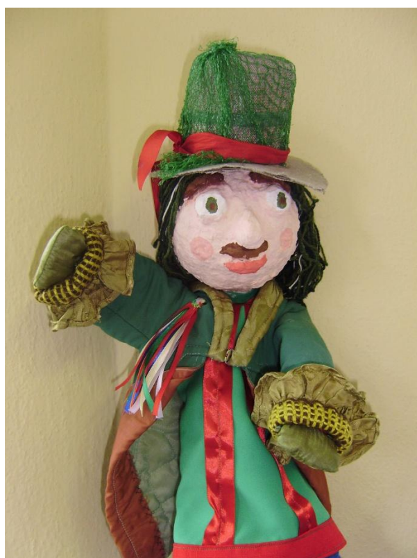
předloha na plakát, vyrobili žáci ZUŠ