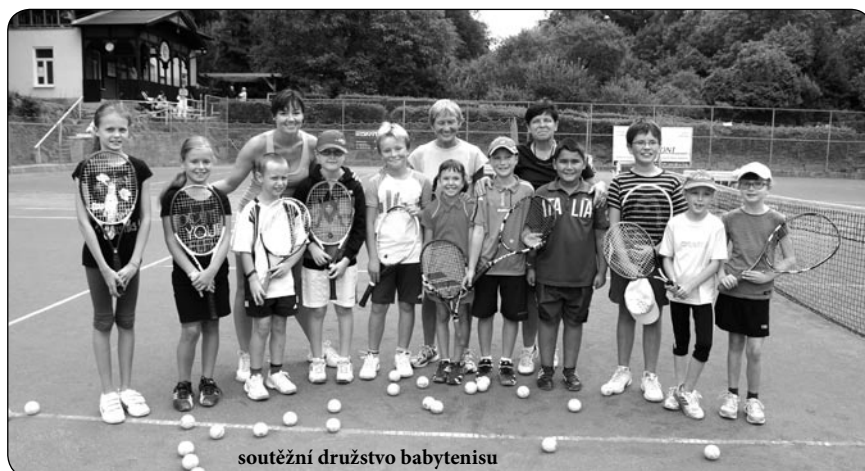
soutěžní družstvo babytenisu