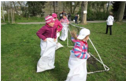
Projektový den ke Dni země se konal v parku.