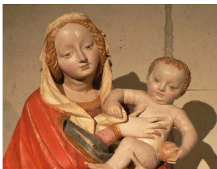
Na výstavě je k vidění také Šternberská madona.

Výstavu připravila MKZ s podporou Vlastivědného muzea, Muzea umění a Arcidiecézního muzea v Olomouci, Státního archivu v Olomouci, Státního hradu Šternberk a města Šternberk. (red)