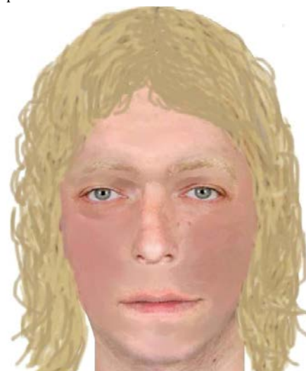
IDENTIKIT VRAHA.

Pachatele zachytily při odchodu bezpečnostní kamery, ale jejich záznam nebyl natolik kvalitní, aby se z něj dala určit jeho totožnost. Kriminalisté odebrali stovky vzorků DNA, město nechalo vypsát za dopadení pachatele tučnou odměnu, ale vrah spravedlnosti stále uniká. Pokud ho kriminalisté nedopadnou, bude případ v roce 2025 promlčen. (red)