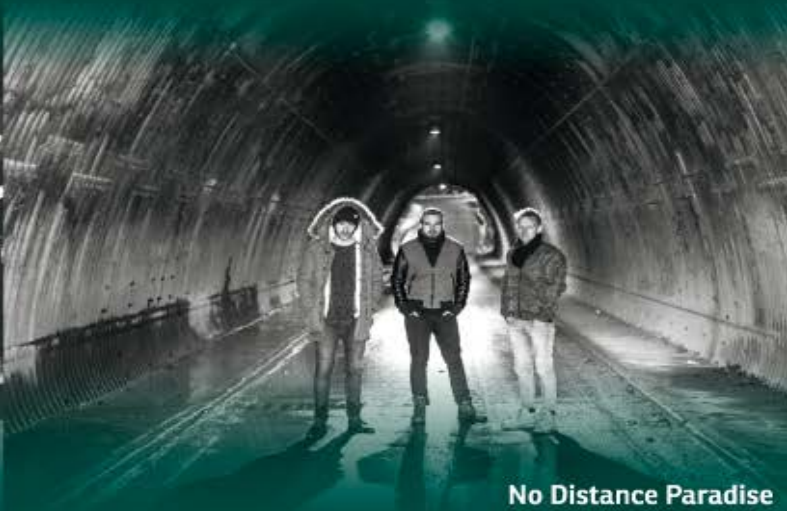
No Distance Paradise