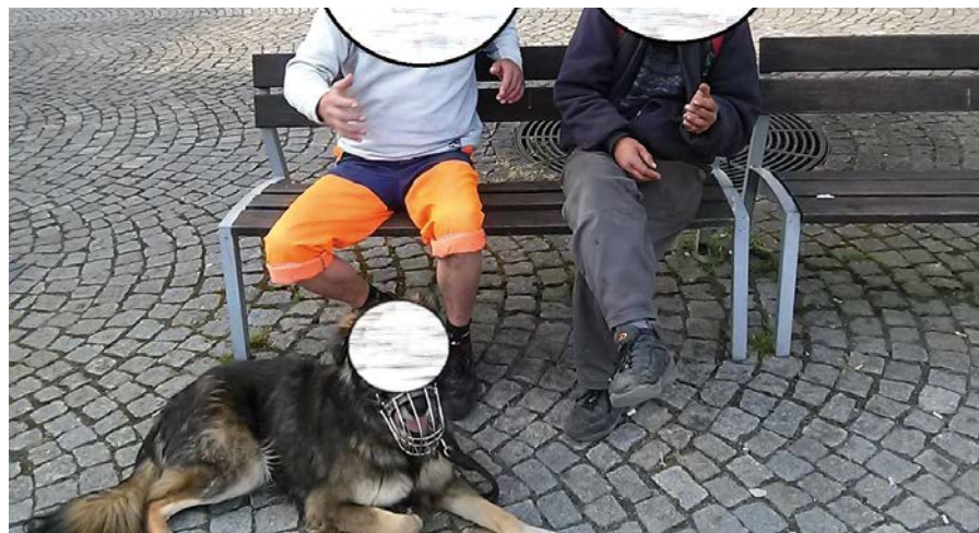
Lidé se v ulicích necítí bezpečně především kvůli sociálně nepřízpusobivým občanům.

Zdroje: Zpráva o bezpečnostní situaci OO PČR Šternberk za rok 2015 a Průzkum vnímání pocitu bezpečí ve Šternberku 2015 (kap)