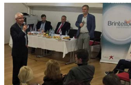
Psychosomatická konference proběhla už potřetí.