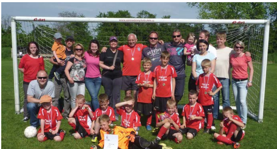
Tým FC Lužice na mezinárodním turnaji v Brně v roce 2015, kde sklídl zlatu.

V neděli 21. února odjeli hoši na turnaj do Bruntálu, kde vyhráli všechny zápasy. Na druhém a třetím místě skončily týmy Šumperka a jako čtvrtý se ve výsledné tabulce umístil domácí Bruntál. „Dostali jsme jen dvě branky a kluci jezdili po zadku ve všech utkáních,“ komentoval turnaj jejich trenér. Vynikající výsledky mají podle jeho slov i ostatní týmy klubu FC Lužice, jež jsou také složeny převážně ze šternberských hráčů. (red)