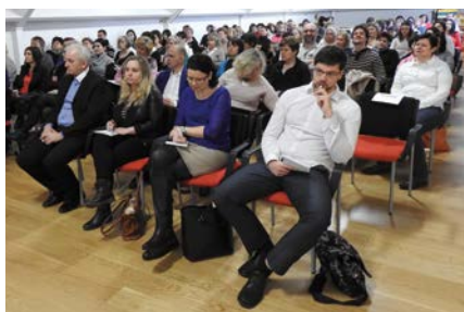
Konference „Ze závislosti do nezávislosti nejen v PL“

Konference se zúčastnili zástupci z MFČR a MZČR a také zástupci organizací zapojených v projektu START, kterými jsou Město Šternberk, Charita Šternberk, Charita Olomouc a Mana, o. p. s. Dále. Tímto Všem děkujeme za účast na konferenci a jejich zájem nahlédnout do systému psychiatrické péče v PL Šternberk a v Norsku.