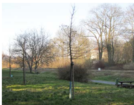
Stromy budou na Den Země vysazeny v těchto místech - na začátku cyklostezky vedoucí do Štarnova.