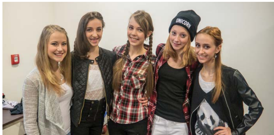
V zákulisí panovala mezi dívkami přátelská atmosféra. Fotografie z finálového podvečera na str. 23.