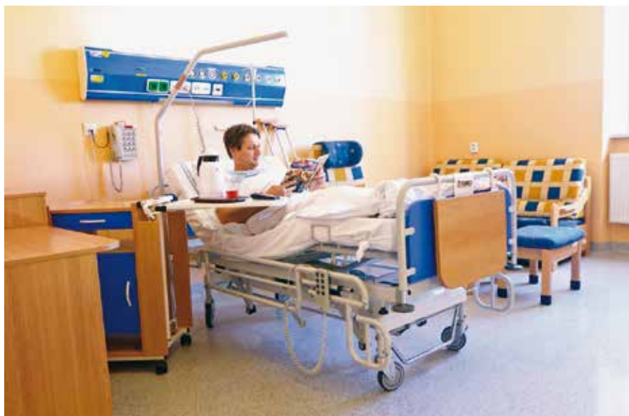
Ilustrační foto: Nemocnice Šternberk

Vůbec první akreditaci získala Nemocnice Šternberk již v roce 2008. První obhajobu pak nemocnice úspěšně zvládla v roce 2011, další v roce 2014 a třetí nyní, na konci loňského roku. (red)