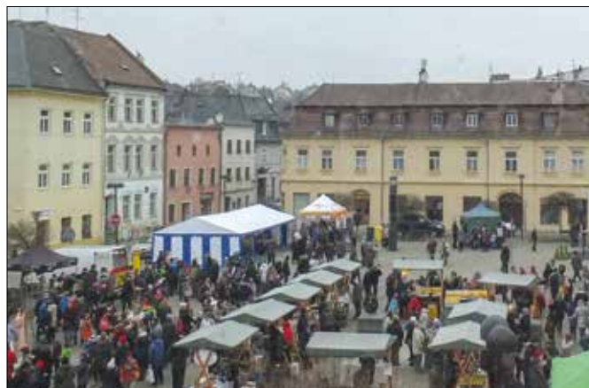
Historická fotografie je vystavena v galerii pekařství Dobrotu MILDA, současný snímek pořídil na únorovém Masopustním jarmarku pan Vojtěch Gottwald.