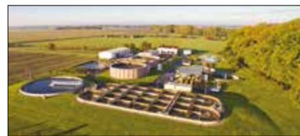
Čistírna odpadních vod Šternberk.

VHS SITKA, s. r. o. poskytuje i další služby v oblasti vyhledávání úniků vody, provádí následné opravy, vyváží jímky, čistí kanalizace, provádí deratizaci apod. V posledních letech realizovala významné projekty, jako například dokončení odkanalizování aglomerace Šternberk, přistoupila k rozsáhlým opravám zanedbaných vodojemů, čerpacích stanic, vodních zdrojů a dalších objektů. Obnovy se dočkaly i vodovodní a kanalizační řady, které byly za hranici životnosti, případně postavené z nevhodných materiálů. Společnost pak pokračovala v modernizaci vlastního zařízení.