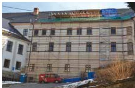
Oprava klášterní střechy byla zahájena 3. ledna.

Letos byla na klášteře hned po Novém roce zahájena první etapa opravy střechy. Stavba bohužel není národní kulturní památkou (NKP); o to složitější bude získat na její obnovu dotaci, neboť většina dotačních titulů se v tomto programovém období zaměřuje právě na NKP. Celá oprava je vyčíslena na dvacet milionů korun a měla by být provedena během tohoto a příštího roku. Stávající první etapa zahrnuje západní a jižní křídlo. Další investice půjdou letos v klášteře do přípravy prostor, ve kterých pak budou vystaveny exponáty po původním zdejším německém obyvatelstvu.