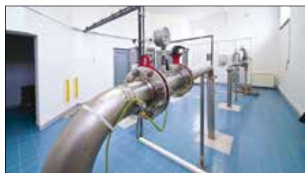
Interiér vodojemu Tolstého ve Šternberku.