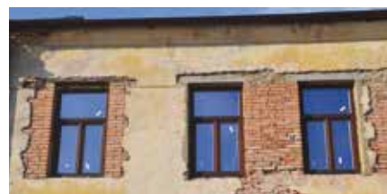
Z domu č. p. 2 v Bezručově ulici zmizela vloni trojdílná okna a nahradila je nová, připomínající původní podobu oken. Letos bude majitel domu pokračovat na jeho obnově opravou fasády.

Na domy, které stojí v MPZ, ale nejsou památkami, myslí město se svým vlastním dotačním programem. Obnovilo ho v loňském roce, kdy do něj ze svého rozpočtu nasypalo půl milionu korun. Žadatelů se tehdy přihlásilo tolik, že tato částka zdaleka nestačila. Letos ji tedy město navýšilo na dvojnásobek. Kdo měl zájem z ní čerpat, mohl si požádat o dotaci do 20. února.