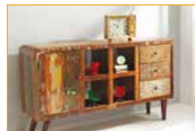
3x ilustrační foto

Reminiscenční koutek vzniká za podpory ESF z projektu „Standardizace procesů a zkvalitnění sociální práce v domově pro seniory“.