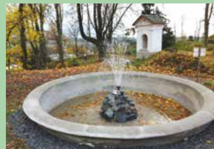
Kamenná nádrž na Křížovém vrchu.

Město Moravský Beroun nechalo zrestaurovat kamennou nádrž na Křížovém vrchu. Získalo na to státní příspěvek 62 tisíc korun; celkem vyšla tato akce na 104 tisíce.