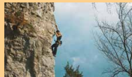
Snímek z filmu Teorie Šťěstí.