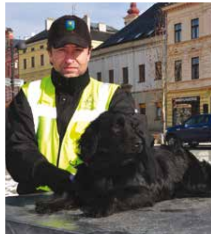
Tento pes si na služebně MP Šternberk také pár dnů pobyl, ale nakonec bohužel skončil v útulku.