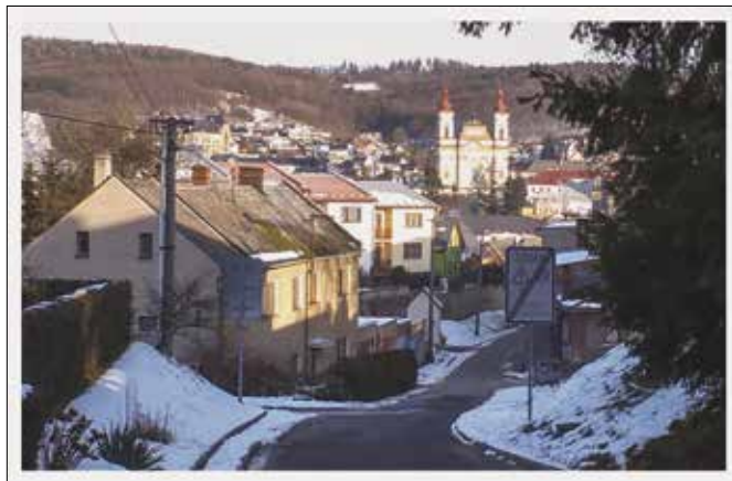
Historická fotografie je vystavena v galerii pekařství Dobrotы MILDA, současný snímek pořídil pan Vojtěch Gottwald.