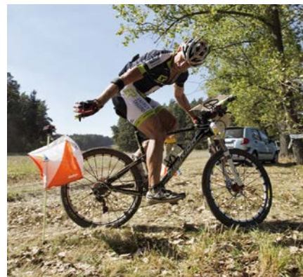
Orientační biker.