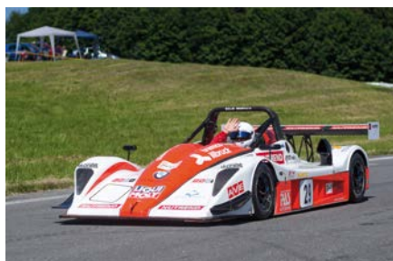
Domácí jezdec Jiří Svoboda při loňském ročníku závodů do vrchu Ecce Homo.

Vážení příznivci sportu - motoristického obzvláště - slyšíte to burácení motorů a vůni spálených pneumatik? To proto, že se nezadržitelně blíží už 111. ročník jednoho z nejúspěšnějších závodů v České republice - šternberské Ecce Homo. Od 3. do 5. června máte možnost vidět již po 36. nejlepší jezdce Evropy a přijít podpořit české závodníky v bojích o nejlepší umístění v evropském šampionátu.