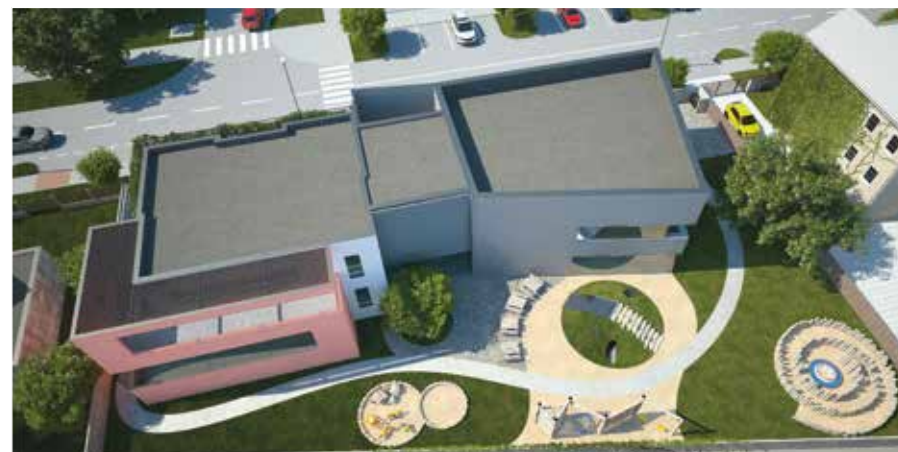
Přibližně takto by už letos měla vypadat Mateřská škola Nádražní.

Na tento rok je také v plánu zahájit velké opravy učeben na základních školách a jejich dovybavení informačními technologiemi. Pár investičních akcí plánuje ve Šternberku realizovat i Olomoucký kraj. V letech 2018 a 2019 počítá např. se zahájením rekonstrukce ulice Věžní, včetně dvou okružních křižovatek; jedna bude u čerpací stanice a druhá u sídliště Uničovská. „U některých investic vyčkáme na spolufinancování ze státního rozpočtu nebo Evropské unie,“ vysvětlil starosta Orság a měl tím na mysli například cyklostezku do Dolního Žlebu, opravu Olomoucké ulice nebo výstavbu atletického stadionu. (red)