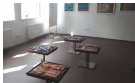
Komorní sál v době rekonstrukce a nyní.