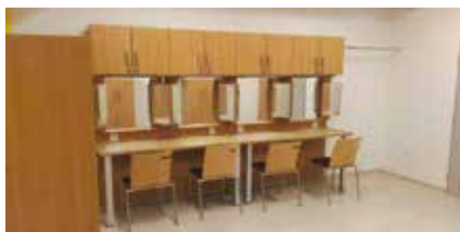
Původní a současná podoba šatny.

V suterénu pod jevištěm byly vybudovány dvě moderní šatny pro účinkující, každá se samostatným hygienickým zázemím. Vybudování šaten přišlo na dva miliony korun.