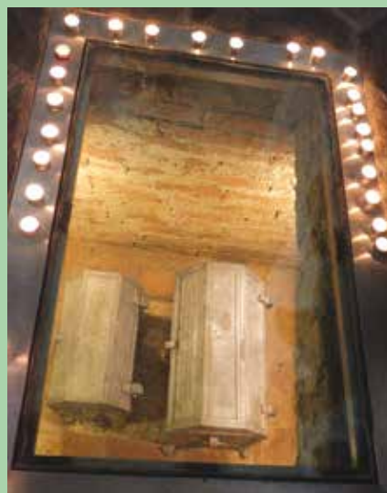
Krypta s ostatky posledních Sternbergů: Arcibiskupa Alberta II., synovce Petra a jeho ženy Rebečky z Kravař.

zádušní mše, a na příslušníky českého šlechtického rodu bude vzpomenuáno při bohoslužbě za zemřelé. Pořádání Dnů rodu Sternbergů má své kořeny v události, která se odehrála