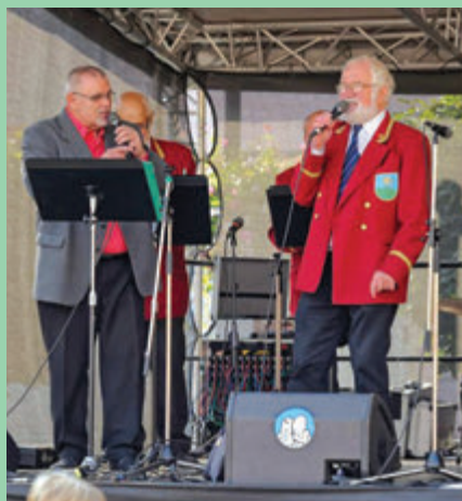
Na slavnostech nechyběla ani dechovka Šternberanka a mažoretky z Bohuňovic.