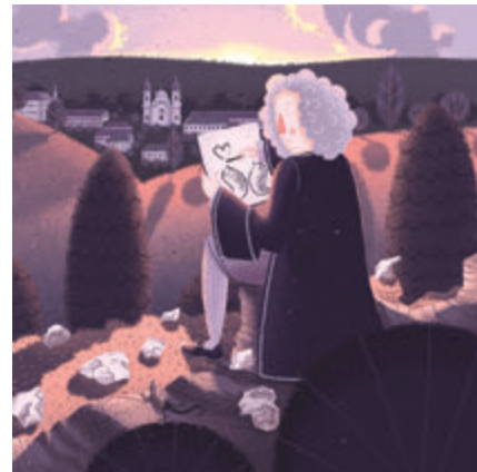
Malíř Jan Kryštof Handke právě maluje čtyři jinotajné obrazy, jenže se nedokáže trefit do představ zadavatele - probošta kláštera ve Šternberku. Musíte mu pomoci!

Trasa je dlouhá 4 kilometry a stoupá z centra Šternberka do lesa, kde nabízí odpočinková místa s krásnými výhledy a příjemnou pro-