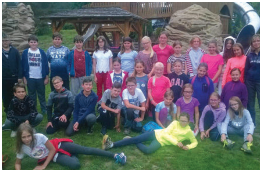
Seznamovací kurzy tříd prima A, 1. A se konaly ve Staré Vsi u Rýmařova.