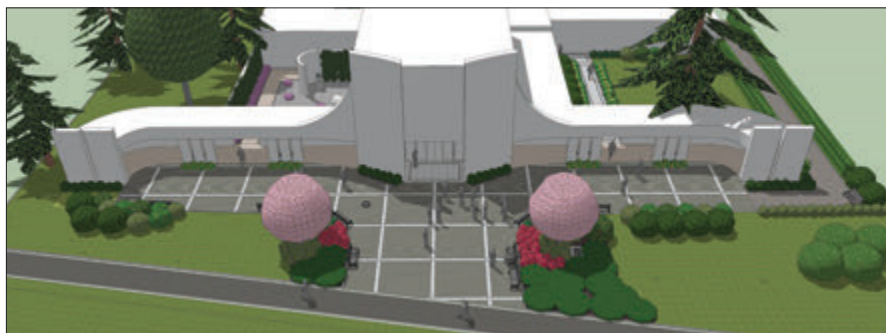
Přibližně takto by měl koncem října po opravách vypadat prostor před smuteční síní na hřbitově.

níků na městském hřbitově se zlepšením přístupu ke smuteční síní a kolumbáriu,“ uvedla mluvčí města Irena Černocká a dodala: „Město Šternberk dohodlo se zhotovitelem stavby takový režim stavebních prací, aby došlo k co nejmenšímu omezení návštěvníků hřbitova. Nicméně v této souvislosti si dovoluujeme návštěvníky hřbitova požádat, aby v průběhu října dbali zvýšené opatrnosti při pohybu v areálu hřbitova a tolerovali možné komplikace v přístupu ke smuteční síní a kolumbáriu bezprostředně sousedícími s upravovaným prostorem.“ (red)