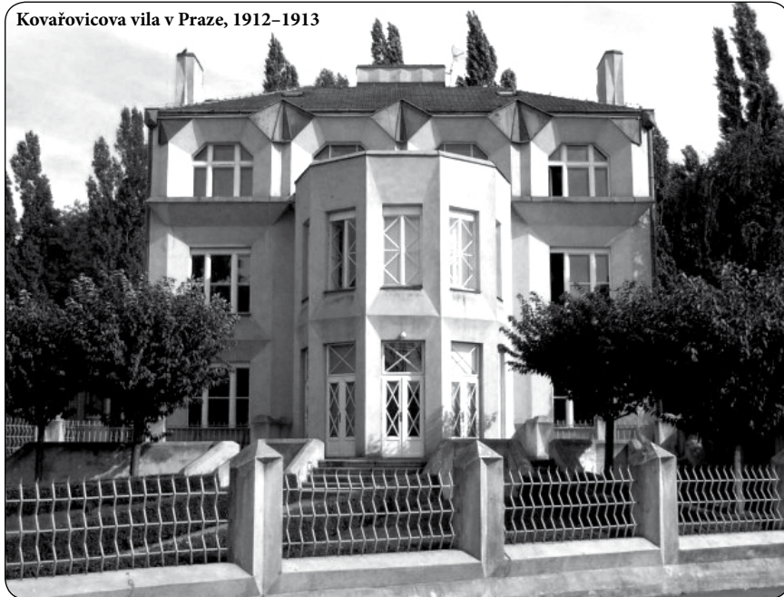
Kovařovicova vila v Praze, 1912–1913