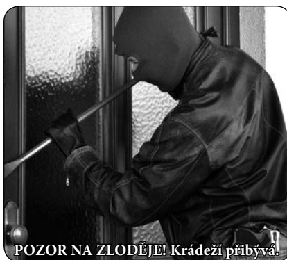
POZOR NA ZLODĚJE! Krádeží přibývá.

ŽÁDNÉ OKOLKY. Měděný okap ukradl kdosi v noci na 7. května od domu na ulici Smetanova. Přestože vyrušený majitel domu ihned přivolal hlídku, na místě ani v okolí se již nepodařilo pachatele dostihnout. Způsobil tak škodu