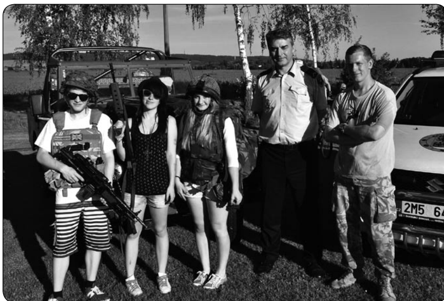
Na dětském dni v Babicích, obci, kde na základě smlouvy působí také Městská policie Šternberk, si děti mohly prohlédnout vybavené policejní vozidlo a společně s Land Roverem armádních nadšenců si vyzkoušet stíhání s houkačkou. Krásné počasí bylo pro podobnou akci jako stvořené. Děkuje za pozvání!

PŘIDUSIL SE OBĚDEM. Podezření z požáru v jednom z domů na Hlavním náměstí prověřovala hlídka v sobotu 7. června ve 14:30. Z okna se valil dým, ale jak sdělil uživatel bytu,