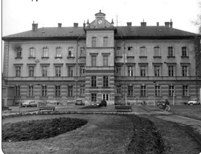
Historický pohled na hlavní budovu...