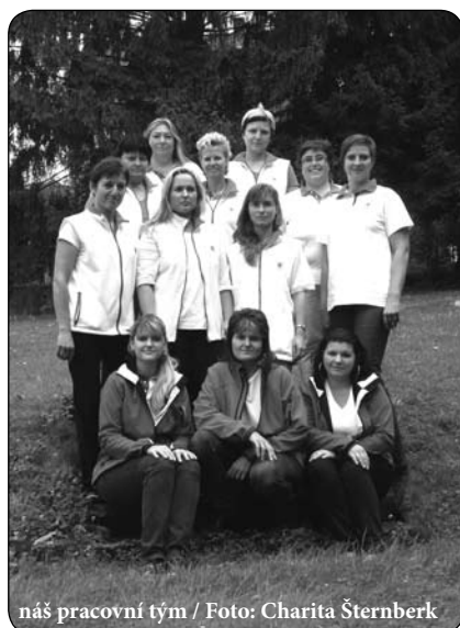
naš pracovní tým