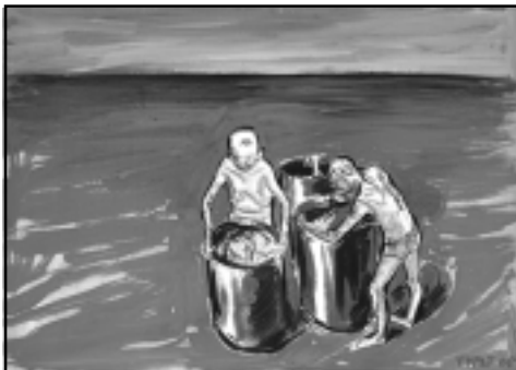
Lubomír Typlt, Dívají se , 2006, tempera na papíře, 50 x 70 cm

Šternberská výstava Lovci lebek je reprízou výstavy v Galerii U Bílého jednorožce, ale pouze v technickém slova smyslu. Způsobem instalace i výběrem vystavených exponátů je výstava originální vůči své mateřské variantě. Na-