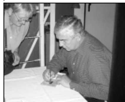
Miroslav Donutil se v Tylově divadle podepisuje svým příznivcům.