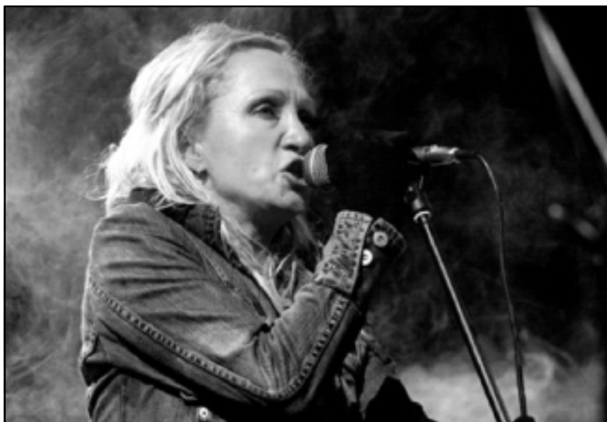
Jednou z hvězd loňského ročníku Šternberského kopce byla zpěvačka Bára Basiková.