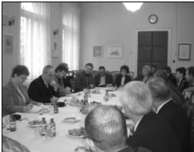
Pracovní jednání starostů partnerských měst.