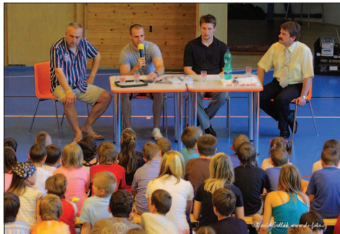
Oba hokejisté jsou držitelé bronzové medaile z Mistrovství světa juniorů 2005.

tiskové konference a besedovali se žáky základní školy Dr. Hrubého ve Šternberku, kde uspořádali za velkého zájmu dětí autogramiádu. Oba hráči jsou velmi dobrým příkladem toho, že i sportovci z malého města mohou být úspěšní i v zámoří a reprezentovat tak nejen Českou republiku, ale i Šternberk. Oba sportovci přislíbili svou účast i na dalších akcích ve Šternberku, např. bylo dohodnuto, že budou členy sportovního týmu prvního ročníku soutěže Šternberský bojovník, která se uskuteční 16. srpna letošního roku. (IČ)