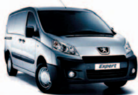
Expert ■ cena od 378 000,- vč. DPH