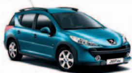
207 SW ■ cena od 259 900,- vč. DPH