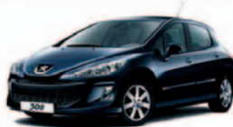
308 ■ cena od 364 900,- vč. DPH