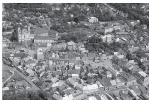
Městská kulturní zařízení – Galerie Šternberk vás srdečně zvou na výstavu