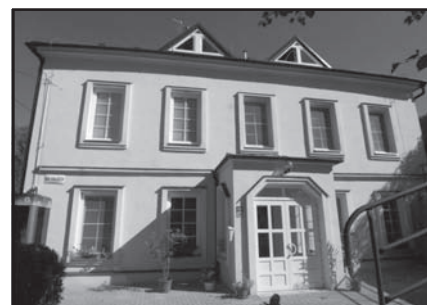
Fotografie Ošetřovatelského domova, Na Valech 14

DANA ZEDNÍČKOVÁ, vedoucí Ošetřovatelského domova