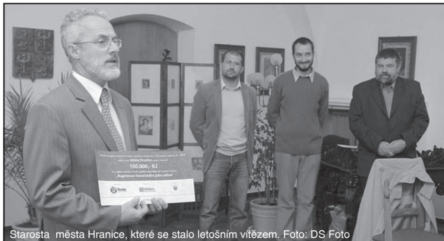
Starosta města Hranice, které se stalo letošním vítězem.

tifikátu obdrželo město také prémii v hodnotě 80 tisíc korun, které plánujeme využít na doplnění zeleně v centru Šternberka. Celkem bylo do loňského ročníku soutěže přihlášeno 30 projektů z celé republiky. Odborná komise, vedená předsedou doc. Ing.arch. Janem Mužíkem, CSc., vedoucím ústavu urbanismu Fakulty architektury ČVUT, ocenila celkový přínos šternberského projektu z hlediska všech základních kritérií hodnocení, tj. přínosu řešení pro zvýšení bezpečnosti provozu, komplexnosti řešení dopravy, inovativnosti a originality řešení a celkové kvality veřejného prostoru a prostředí. (IČ)