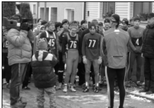
Start Zimního běhu přes Kosíř ve Slatinicích.