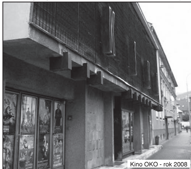
Kino OKO - rok 2008