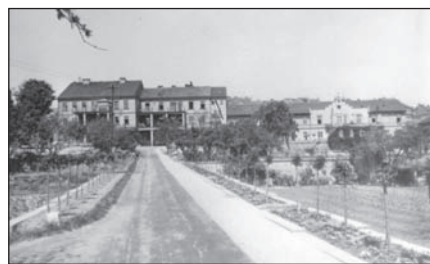
Budova Vincentina v Praze-Břevnově

Rok 1945 byl plný radosti z osvobození republiky a z přežití všech úskalí ve Vincentinu. Zejména opadlo napětí, které bylo vyvoláno snahou Němců zabrat budovy ústavu, zejména ve Smečně. Němci se nijak netajili tím, co čeká postižené, kdyby válku vyhráli... Hlavním úkolem pro Vincentinum v obnovené Československé republice bylo vybudování nového ústavu v Praze, poněvadž stávající budovy nevyhovovaly jak po stránce stavební, tak po stránce hygienické. Pro nedostatek místa ne-