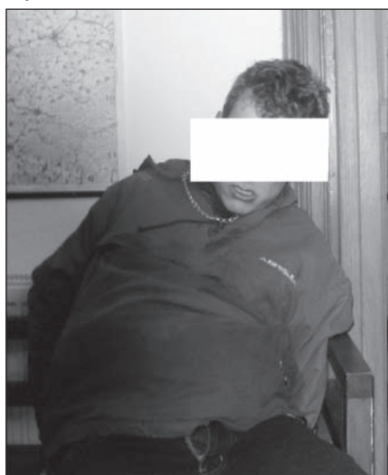
FOTO POPISKA: „Kontejnerový hrdina“ krátce po přistižení. K práci strážníků se vyjadřoval pozitivně. Při rozhodování o převozu na záchytnou stanici mu dokonce zvlhly oči dojetím a snad i slza ukápla na jeho vodami Sítky promočený oděv. FOTO: MP Šternberk

VČASNÉ PŘIVOLÁNÍ. Opakovaně neznámý pachatel zatlačil do koryta Sítky mezi ulicemi Masarykova a Bojovníků za svobodu velkoobjemové plastové kontejnery na odpad. I policie čelila kritice, když se žádného z vandalů nepodařilo dopadnout. Ve středu 4. února kolem osmé večer však díky všímavosti a rychlé reakci spoluobčanů byli strážníci úspěšní. Bleskově zareagovali na telefonické oznámení a ještě při příjezdu spatřili dva pachatele, tlačící do potoka právě čtvrtý kontejner. I když jeden přes potok uprchl, druhého se podařilo zadržet. Mladík byl podnapilý díky svým asi 2,1 promile alkoholu v krvi, choval se agresivně a snažil se z místa utéci. Nakonec si vysloužil pouta a skončil po předvedení na služebně MP. Nyní se šetří další okolnosti nutné pro náhradu škody v dalším jednání před přestupkovou komisí. Jsme si vědomi toho, že spolupráce s občany při potírání vandalismu je rozhodující a nejúčinnější prostředek! Děkuje.