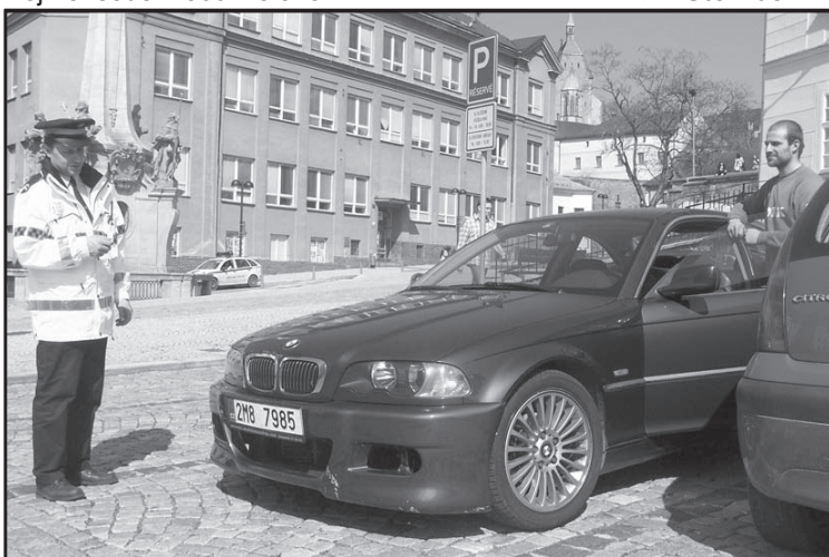
S přicházejícím jarem strážníci zpřísnili kontroly parkování v zóně v centru města, ale nejen to, pravidelně kontrolují park a místa, kde se scházejí závadové osoby.