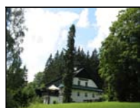
Chata Karlovka naše týdenní útočiště.