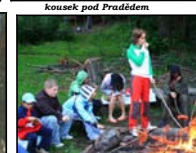
rozhlaňkový táborový ohně s opékáním