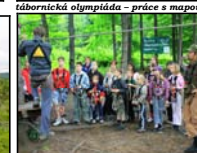
lanové centrum – instruktáž před lezením