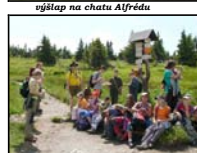
odpočinek nad Ovčárnou