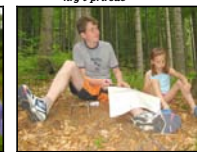
tábornická olympiáda – práce s mapou