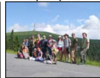
kousek pod Pradědem