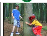
Hry v přírodě