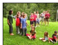
a opět si hrajeme .....