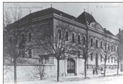
Šternberk, Opavská ulice a budova soudu v roce 1920, dnes městský úřad

městská rada finančně podpořit výstavbu malých a levných rodinných domků pro sociálně slabší občany. Současně začala prodávat městské pozemky soukromým stavebním firmám a družstvům na stavbu obytných domů. V roce 1924 tak bylo mj. obecně prospěšným stavebním a bytovým družstvem „Mein Heim“ vystavěno 19 nových obytných domů na Olo-mouckém předměstí, které získaly označení „Družstevní čtvrť“ (Genossenschaftsviertel).