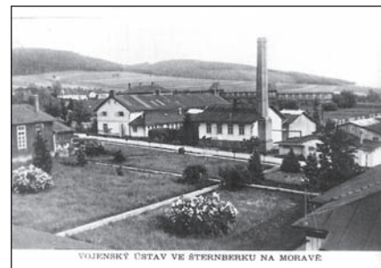
Šternberk, Vojenský ústav v roce 1920, dnes VOP 026 s.p. Šternberk