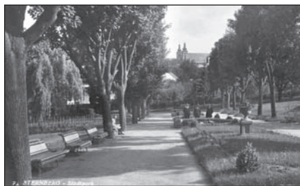
Šternberk, městský park vybudovaný na místě zrušeného hřbitova v letech 1925 – 1928

Hospodářskou a sociální krizi ve Šternberku komplikovaly i vyostřené národnostní poměry. Velká část německého obyvatelstva města v čele se svými vrcholnými představiteli se jen těžko smiřovala s novou československou státní mocí. Masový protest u příležitosti zahájení jednání německo-rakouského národního shromáždění dne 4. března 1919 dokonce přerostl v přímý konflikt s ozbrojenou mocí nového státu a následné krveprolití, které si vyžádalo 17 obětí na lidských životech.