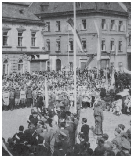
Oslavy osvobození města na Hlavním náměstí 2. září 1945

Šternberk zůstal správním střediskem okresu, začleněným do vládního obvodu Opava v rámci tzv. Sudetské župy (Sudetengau) Velkoněmecké říše. Současně se stal pohraničním městem, v jehož bezprostřední blízkosti probíhala nová říšská hranice s okleštěnou Česko – Slovenskou republikou a po 15. březnu 1939 s okupovaným Protektorátem Čechy a Morava.