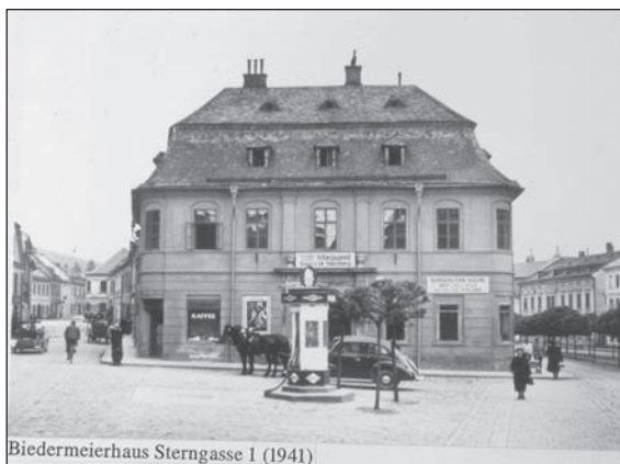
Biedermeierhaus Sternegasse 1 (1941)

V průběhu r. 1948 se ještě uskutečňovaly cíle