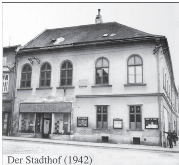
Der Stadthof (1942)