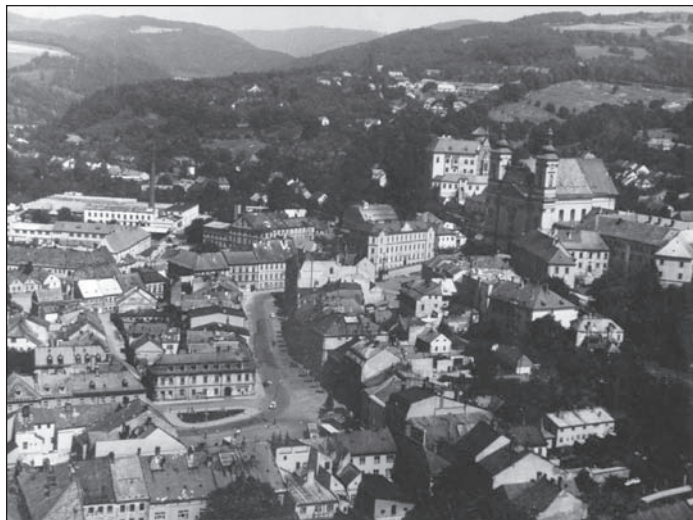
Centrum města v roce 1975

V roce 1969 si obyvatelé města Šternberka připomínali 700. výročí první písemné zmínky o zdejším hradu, daleko intenzivněji však