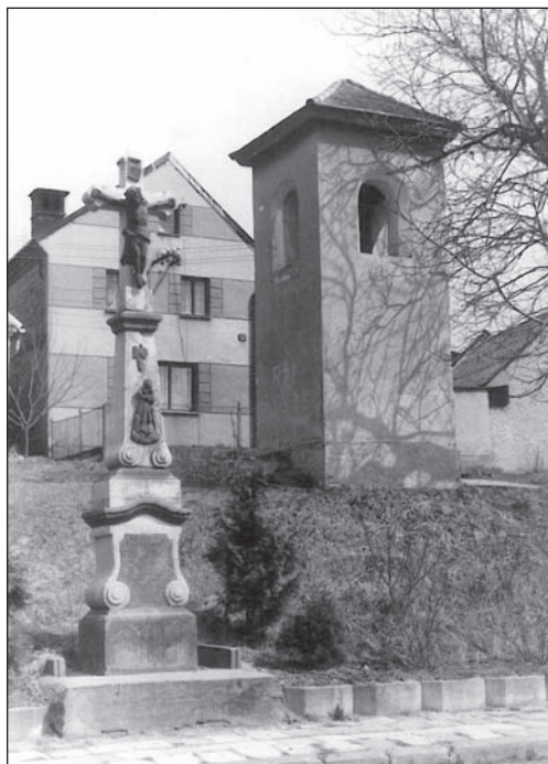
Krakořice v roce 1970