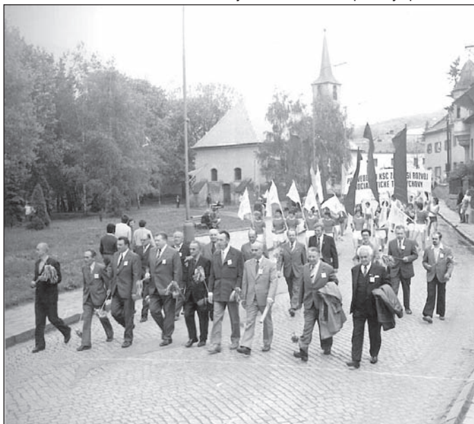
Okresková spartakiáda 9. května 1975

Hlavním lákadlem návštěvníků Šternberka zůstávaly vedle krásné přírody především