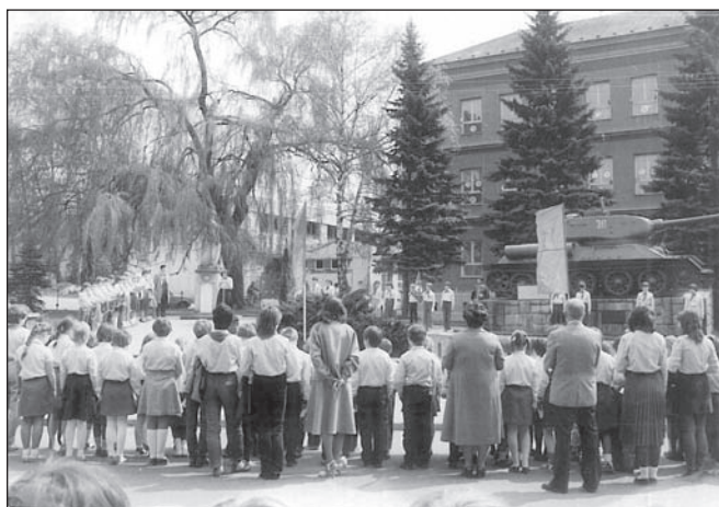
Slavnostní slib pionýrů v roce 1985