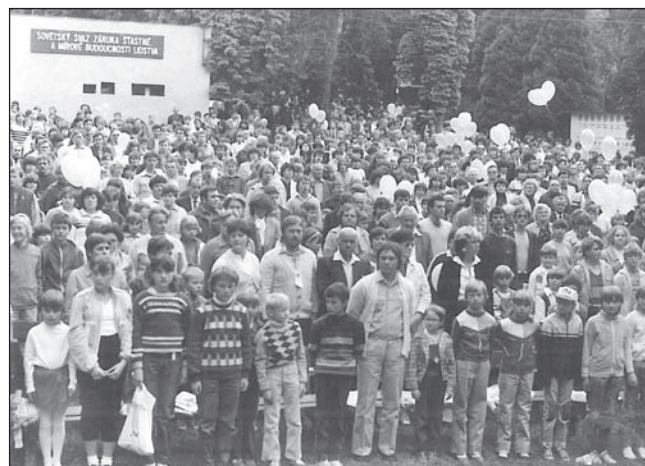
Okresní mírová slavnost v areálu hradu v roce 1986