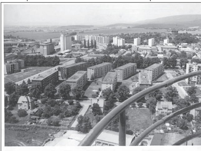
Pohled z 80 metrů vysokého komínu dokončeného v roce 1982

rožitných kapesních hodinek a několik dalších cenností. V roce 1988 byla v přízemí muzejních prostor instalována nová expozice „Časoměrná technika v Československu po r. 1945“.