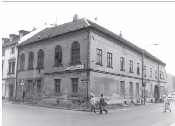
Dům Osvěty v roce 1985

K 1. červenci 1979 se Šternberk rozrostl o další integrované obce – k městu byly připojeny Mladějovice s místními částmi Komárovem