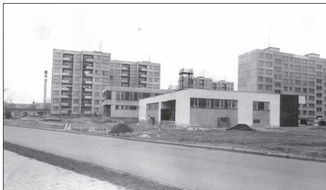
Stavba samoobsluhy a restaurace na sídlišti na Unicovské ulici 1984

teriálu a stavebních kapacit vybudován v plánovaném rozsahu, v r. 1979 byl zřízen pouze jako procházkový chodník do rekreační oblasti Dolního Žlebu mimo frekventovanou komunikaci.