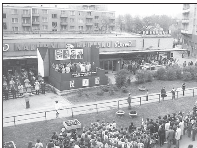
Prvomájové oslavy v roce 1985 ve Šternberku

V souvislosti s rozsáhlou bytovou výstavbou muselo město věnovat pozornost i rozšiřování a modernizaci své infrastruktury. V 80. letech pokračovala, byť s mnoha obtížemi, postupná plynofikace města a stavba nových úseků kanalizace, průběžně modernizována byla rovněž elektrická síť. Vážným problémem zůstávalo zásobování vodou, zejména v letních měsících. Vlekla výstavba nového vodovodu ze zatopených dolů u Krakovic pokračovala v 80. letech stavbou nového vodojemu a úpravní vody v Krakovicích. V r. 1982 byla vybudována čistírna odpadních vod v Dolním Žlebu a o dva roky později i čistírna odpadních vod na městském koupališti. Vodovodní síť ve městě byla ovšem již koncem 80. let za hranici své životnosti. Dosavadní zdroje pitné vody u Krakovic a Moravské Huzové nestačily rostoucím potřebám obyvatel města, jehož vedení uvažovalo o napojení šternberského vodovodu na