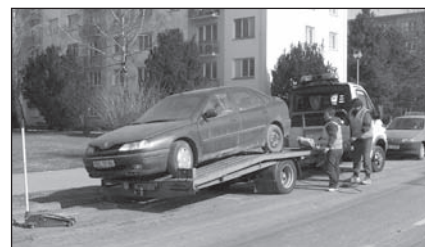
Vraky budou odtaheny!

Na ulicích a parkovištích přibývá vozidel, ke kterým se nikdo nehlásí, nebo je majitelé už nehodlají provozovat. Takové vozidlo bude odtahováno, pokud jeho majitel, evidovaný v dokladech, nesjedná nápravu. Pokud je na komunikaci, lhůta pro jeho odstranění je dva měsíce, ale není vyloučen postih za jiné porušení povinností držitele vozidla. V případě, kdy vozidlo stojí na zeleni nebo jiné veřejné ploše mimo komunikaci, může být odtahováno ihned.