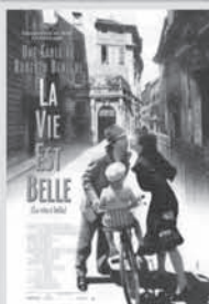
„ŽIVOT JE KRÁSNÝ“