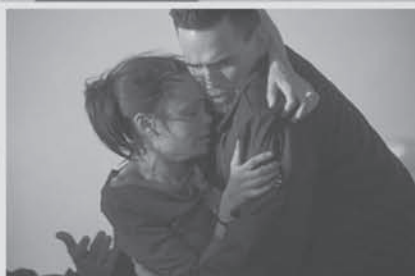
Z filmu „CRASH“

Pátek 30. 7. 2010 - 21.30 hod. - "ŠPATNÁ VÝCHOVA" - (la Mala edukaci6n), ESP, krimi, 101 min., vstupné 50 Kč dospělí, 30 Kč mládež do 26 let. /Snad nejslavnější film španělského režiséra Pedra Almod6vara./