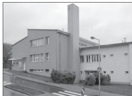
Těší se na Vás kolektiv ŠJ