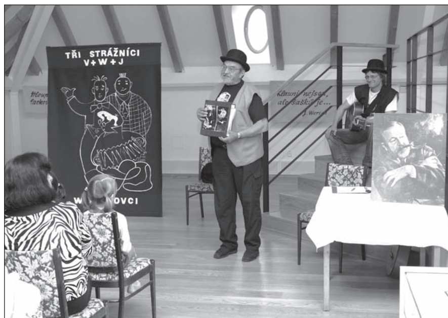
MULTIFUNKČNÍ PROSTOR. Ve druhém poschodí objektu se často pořádají nejrůznější kulturní i společenské akce.

Rekonstrukcí budovy tak vznikl moderní a kvalitní základ pro instalaci expozice, díky které si Šternberk opět zaslouží přívlastek „město hodin“. (bra, red)