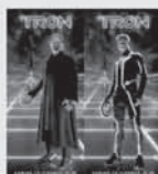
film TRON: LEGACY