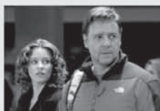
film TŘI DNY KE SVOBODĚ