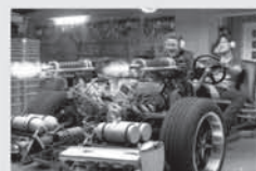
film ZELENÝ SRŠEŇ