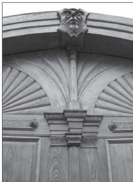
VÍTEJTE. Zrekonstruovaná vrata vedoucí do budovy.

Původně významný měšťanský dům v ulici ČSA 19 ve Šternberku byl před rekonstrukcí velmi zchátralý. Nárožní, částečně podsklepený objekt má dvě patra a půdu se sedlovou střechou; půdorys je nepravidelný, stěny v místnostech nejsou pravoúhlé a podlahy jsou v různých výškách. Součástí domu bylo i částečně zachovalé klasicistní kamenné schodiště vedoucí do půdního prostoru. Fasáda byla zakončena korunní římsou a sedlovou střechou. Celá fasáda však byla strohá, bez štukové výzdoby, pouze omítnutá žlutou barvou.