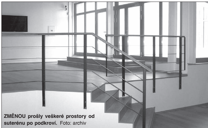
ZMĚNOU prošly veškeré prostory od suterénu po podkroví.

Více informací se dozvíte na straně 5 v seriálu Expozice času krok za krokem. (red)