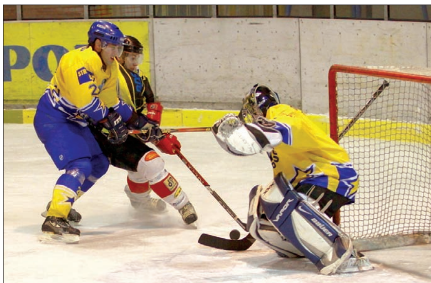
TĚSNÁ VÝHRA. V zápase s Velkou Bíteší si šternberští hráči vybudovali tříbrankový náskok, nakonec zvítězili 4:3.

Vstup do kvalifikace o druholigovou baráž zvládli hokejisté na jedničku: v Moravských Budějovicích vyhráli 7:4. Vítěz v baráži narazí na HC Uničov, který je poslední v moravské skupině druhé ligy. (red)