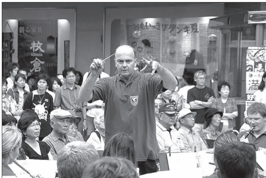
JAPONSKO. V roce 2006 koncertovala šternberská Harmonie v japonském městě Shi- zuoka.

Šternberk nominuje na Cenu Olomouckého kraje v oblasti kultury za rok 2010 (v kategorii Výjimečný počin v oblasti neprofesionální umělecké činnosti) orchestr Harmonie. V roce 2009 uspěl v téže kate-