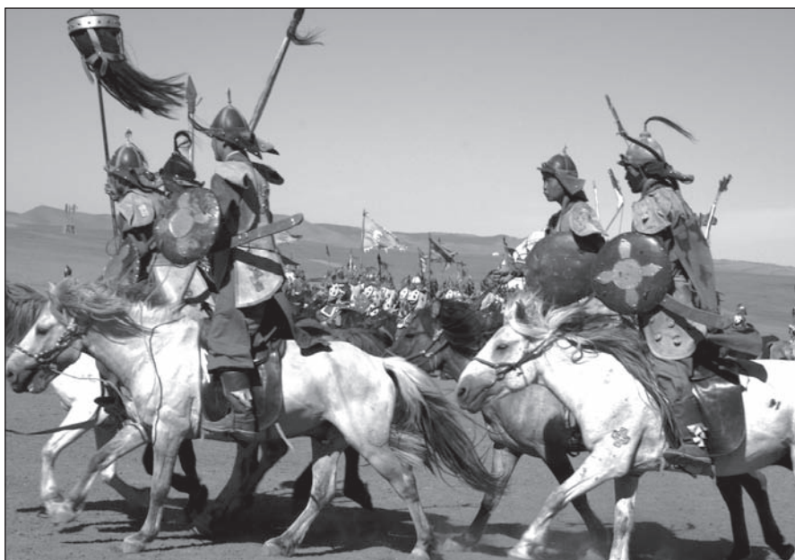
MONGOLSKO. Jedním z filmů, který se na festivalu představí, bude i slovenský snímek Mongolsko režiséra Pavola Barabáše.

Máte rádi divokou přírodu a poznávání hranice lidských možností? Chtěli byste zažít vodáckou expedici v Indii a Turecku, zimní výstupy v Himálajích a Karakoram, nebezpečné výstupy na skalní stěny, při kterých i zkušeným horolezcům naska-