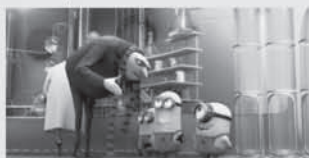
film JÁ, PADOUCH