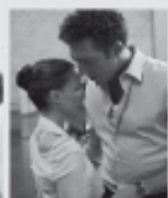
film ČERNÁ LABUŤ