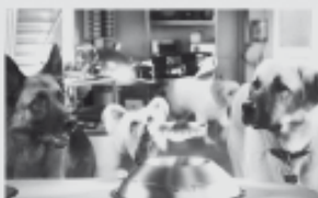
film JAKO KOČKY A PSI 2