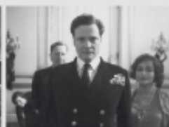
film KRÁLOVA ŘEČ