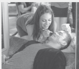
Bláznivá, zatracená láska