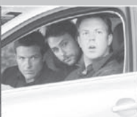
ŠÉFOVÉ NA ZABITÍ