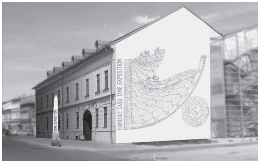
FINÁLNÍ VERZE. Takto bude vypadat objekt po skončení všech prací.

Pro tuto myšlenku získalo město Šternberk podporu nejen v České republice, ale také v zahraničí. Podařilo se získat kooperující partnery v Německu a Švédsku a následně formou grantu také podporu Evropské unie v kategorii projektu „kulturní dědictví“. Město Šternberk tak v roce 2009 obdrželo dotaci 37 milionů korun na dokončení stavebních úprav Expozice času. (red)