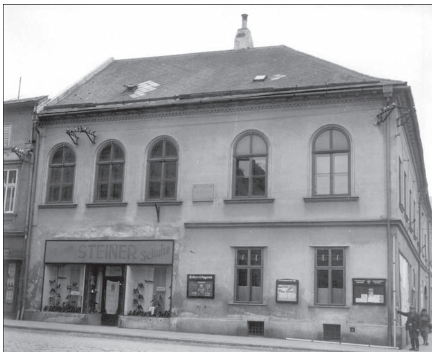
HISTORIE. Takto vypadala budova na ČSA v roce 1935.

Objekt na ČSA 19 – dům č.p. 113 patří k nejstarším domům ve Šternberku, stál zde již na začátku 16. století a rozhodně nebyl stavěn pro běžného šternberského měšťana. Bývala zde tržnice, hostinec, v roce 1593 sladovna, od roku 1674 zde byla dočasně umístěna mučirna a vězení. Objekt sloužil také pro podnikání s kameninou, porcelánem, v 19. století se tu nacházela výrobní pálenka a likérů; od roku 1952 pak byla budova využívána pro kulturní účely – ještě dodnes se jí říká dům osvěty.