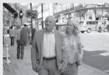
film POZNÁŠ MUŽE SVÝCH SNŮ