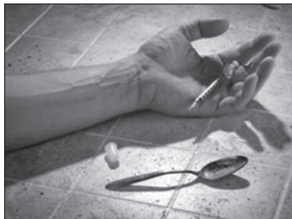
Díl první: Sdružení Podané ruce, pomoc na všech frontách

vám blíže představíme Sdružení Podané ruce a jeho práci ve Šternberku. (red)