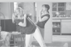
TVŮJ SNOUBENEC, MŮJ MILENEC