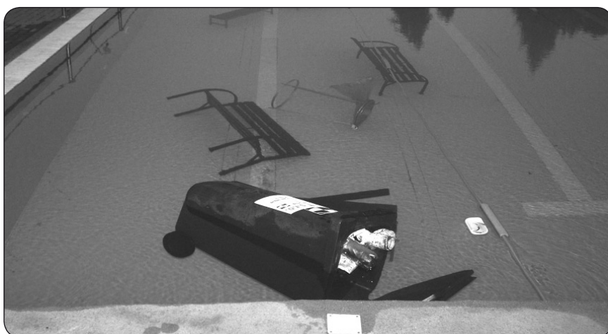
Perné chvíle připravil vandal (nebo vandalové?) provozovateli koupaliště. V noci na 19. srpna někdo naházal do bazénu snad vše, co našel v jeho okolí: lavičky i nádoby na odpad. Čím bylo jednání vandala motivováno, to se můžeme jen domnívat – každopádně si dal „záležet“. Odpovědní pracovníci i čistička s tím měli plno práce!

TRNOVÁK. Dalším zajímavým případem byl nález psa – německého ovčáka, označeného známku města Turnov. Pobíhal volně na ulici Sadová. Přes turnovskou městskou policii se podařilo zjistit, že známka je aktuální,