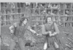
PRINC A PRUĐAS