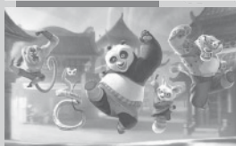
KUNG FU PANDA 2