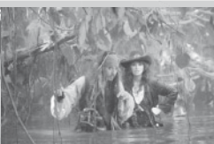
PIRÁTI Z KARIBIKU: NA VLNÁCH PODIVNA