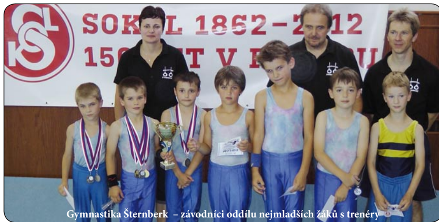
Gymnastika Šternberk – závodníci oddílu nejmladších žáků s trenéry

Závodníci ze Šternberka jako přeborníci Olomouckého kraje zodpovědně reprezentovali naše město na republikových závodech a oslavili začátek prázdnin zlatými a stříbrnými medailemi a pohárem pro náš oddíl sportovní gymnastiky TJ Sokol Šternberk. (mar)