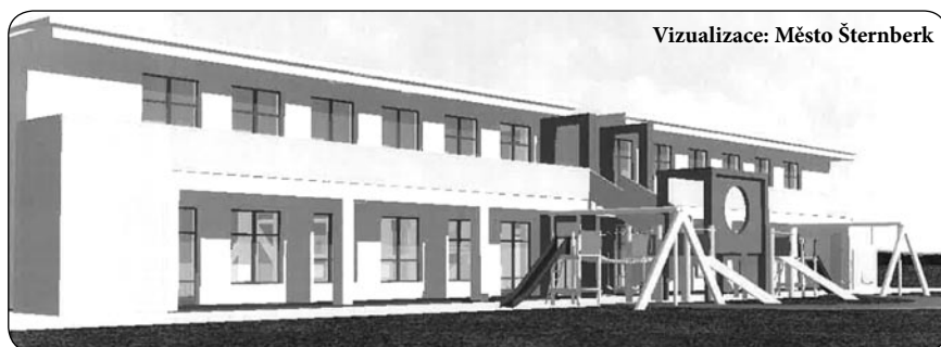
Vizualizace: Město Šternberk

Byla zpracována objemová studie stavby; nová mateřská škola bude řešena jako přehledná, úsporná dvoupodlažní budova. Vizualizace je ke stažení na webových stránkách www.sternberk.eu . (red)