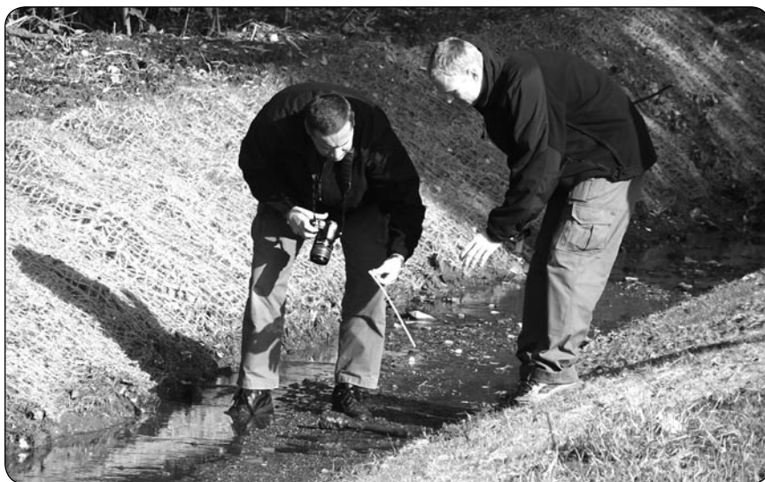
Policejní pyrotechnik dokumentuje nález granátu, který objevili dělníci při dokončování nové retenční nádrže na Olomoucké ulici.

AUTO FUČ. V noci na 18. října byla na ulici Nádražní z parkoviště nedaleko čerpací stanice odcizena zelená Škoda Octavia combi s registrační značkou 4M4 0376. Krádeží tak byla majiteli způsobena škoda asi 120 tisíc korun – v autě měl přitom další věci, např. kompletní rybářskou výbavu v hodnotě 30 tisíc korun. Jednalo se o tři pruty s navijákem, rybářský vak, hlásiče, rybářskou židli atd.