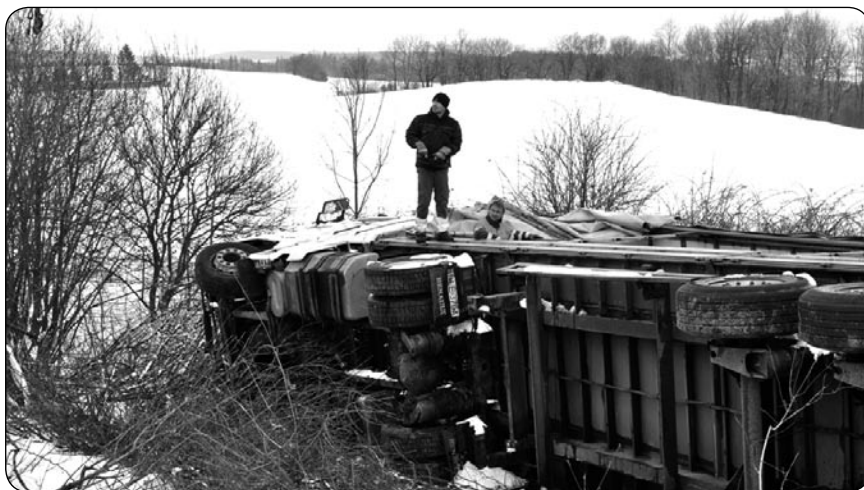
Ve středu 20. února 2013 havaroval polský kamion, který převážel granulát na výrobu plastů z Granitolu Moravský Beroun. Kamion sjel do příkopu a převrátil se na bok. (pra)

PODVOĐ NA POŠTĚ. Částku ve výši téměř 34 tisíc korun, odeslanou jako plnění za pojistnou událost, vybral místo oprávněné osoby na občanský průkaz svého syna na základě