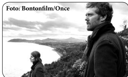
Pro všechny milovníky dobrých filmů a dobré hudby připravila Městská kulturní zařízení Festival hudebních filmů, který se bude konat od pondělí 14. ledna do pátku 18. ledna 2013 v kině Oko. Promítání začíná vždy v 18 hodin,

za každý film zaplatíte 50 korun. Ke vstupence pak dostanete popcorn zdarma.